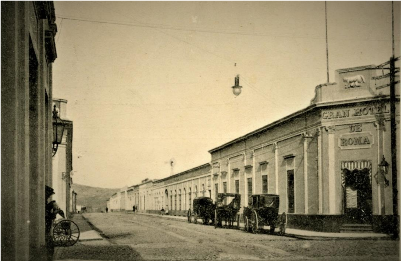
Gran Hotel de Roma, Tandil. Estrups samling

[1902: Tilbage på Madsens gård uden for Tandil]