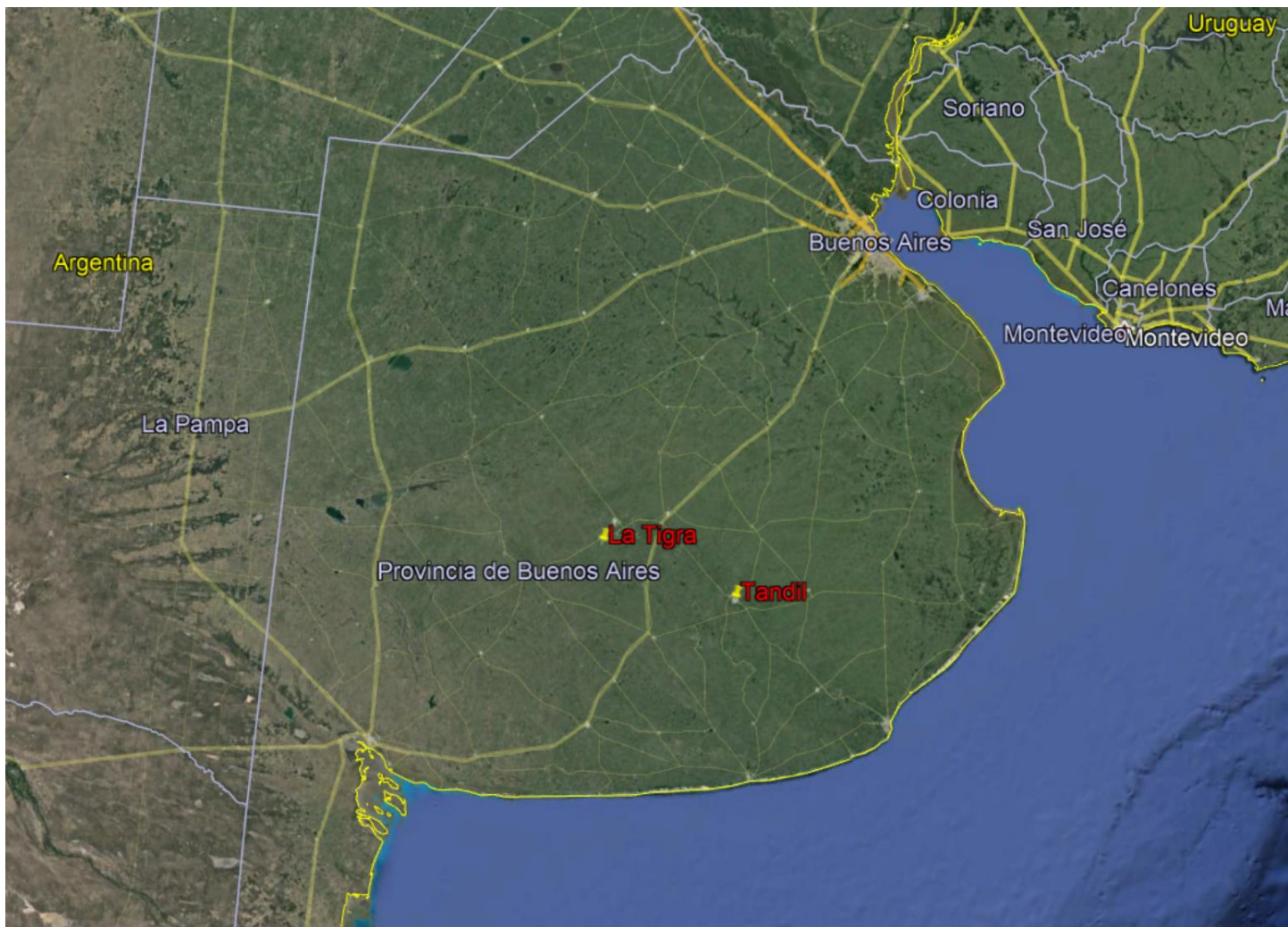
Argentina: Buenos Aires, Tandil and La Tigra. Tandil er 300km fra Buenos Aires i luftlinje