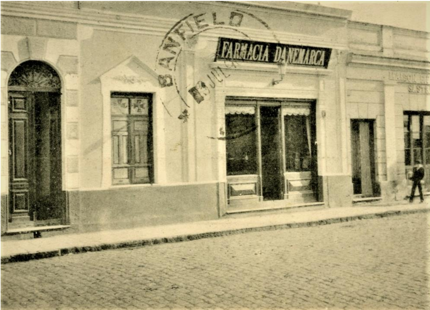
Det danske apotek (Farmacia Danemarca), Tandil. Estrups samling

Manden hentede mig i sit køretøj og vi kørte først til hans moders gård (faderen var død). Hos hende boede begge brødrene. De var ugifte. Jeg fik en glimrende modtagelse. Sov der om natten. Næste dag kørte vi så 10 mil [MV: c. 75 km] ud i landet (pampaen), vort første bestemmelsessted. Ved tærskværket var der ansat ca. 20 unge mænd, hvoraf tre var danske. Jeg fik jobbet som sækkesyer - man havde tørklæde viklet om halsen for ikke at solen skulle brænde hul. Vi arbejdede fra sol til sol (4.30 til 8.30 aften). Stegt kød kl. 8. Suppe og kød kl. 12. Stegt kød ved arbejdets ophør. Tørsten var ulidelig, drikkevandet var lunket. For at holde tørsten fik vi caña, en slags brændevin [MV: lavet på sukkerrør], så man efterhånden løb i en lille kæfert, grundet på den stærke varme. Lønnen var 4 kr. pr dag, hvilket ikke var overvældende i betragtning af den lange arbejdsdag ca. 14 timer.