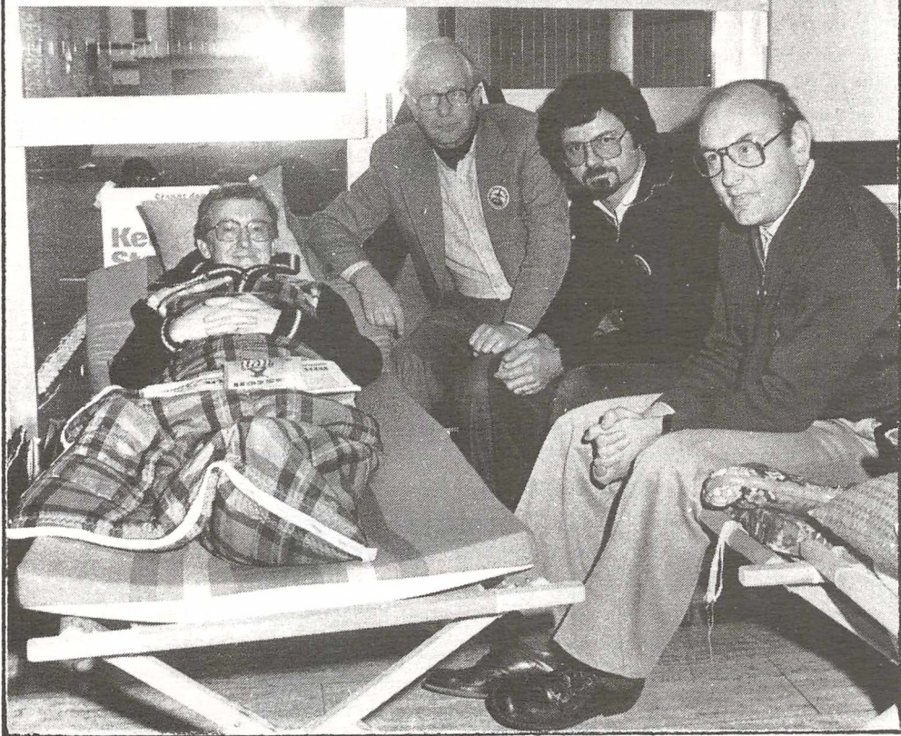
Sultestrejke. Her partiformænd fra CDU, SPD, DKP og FDP. (Fra Kretschmann (hrsg.): Startbahn-West, Oberursel, 1982, p.8)