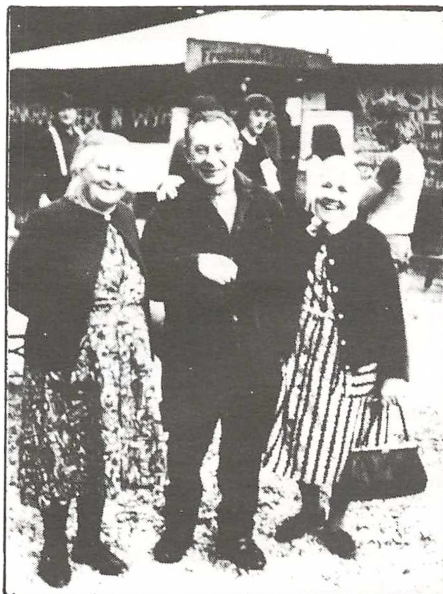
På den besatte plads.