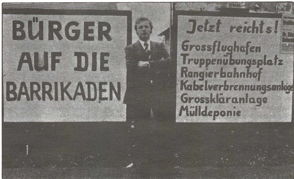
"Borger på barrikaden", omkr. årtiskiftet. (HUG nr. 10, Kbh. 1976, p. 35)

I landområderne udløste kommunesammenlægningerne opret- telsen af talrige borgerinitia- tiver, og også miljøødelæggelse gav anledning til dannelsen af