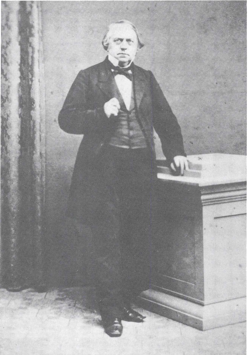
»D.G.Monrad er her fotograferet midt i 1850erne, nogle år efter han iværksatte mormonundersøgelsen på Lolland og Falster. Monrad blev i 1854 afsat fra sit embede som biskop over Lolland-Falsters Stift af ministeriet A.S.Ørsted p.gr.a. hans modstand mod indskrænkninger i Grundlovens frihedsregler.