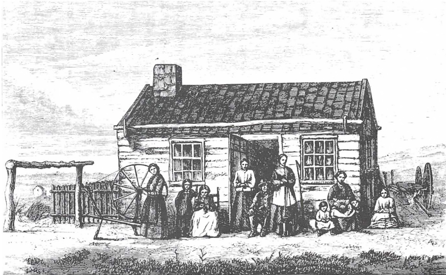
III: En mormon og hans familie.

Xylografiet af en mormon i Utah med sit harem foran en ussel bjælkehytte er et typisk udtryk for det medieskabte fjendebillede af sekten. Billedet bragtes i V.C.S.Topsøes klassiske Amerikabog, »Fra Amerika« fra 1872 (s.387).