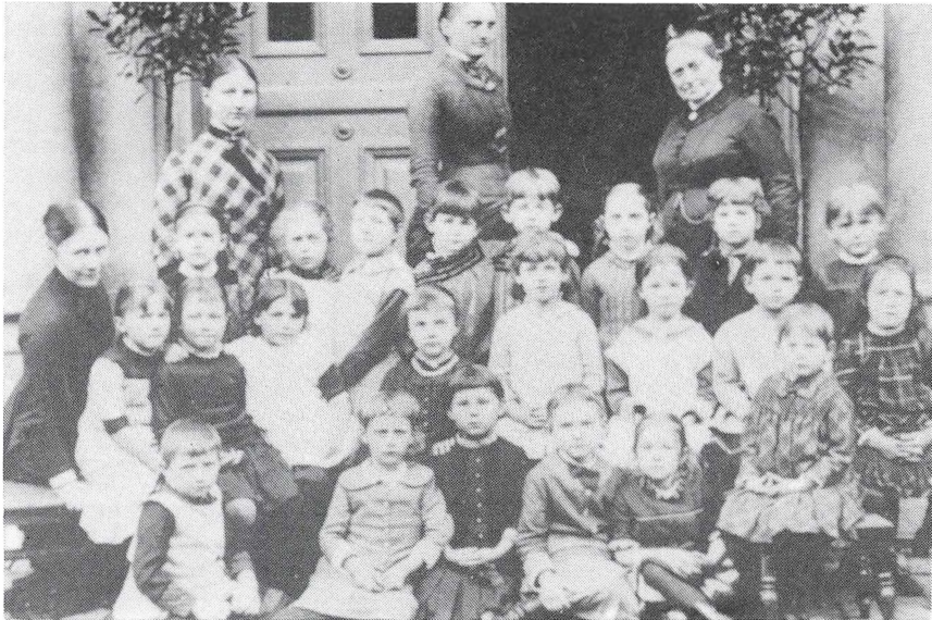
Natalie Zahle med et par lærerinder og første klasse, oktober 1883.

benhavn introduceret hende for Frøbel, Pestalozzi, Rousseau og Grundtvig. Hun havde fulgt med i den debat om døtrenes dannelse, der udspillede sig allerede i 1840'erne om, hvorvidt de unge kvinder skulle opdrages i hjemmene til at blive det huslige livs gartnere eller om de skulle sendes i skole og skabe sig en baggrund for også i en vis grad at kunne gøre sig nyttige i og deltage i det offentlige samfundsliv. Hun var anfægtet og præget af disse strømninger, der hvirvlede rundt om hende. Hun var ingen stor tænker selv. Men hun besad en evne til at samle idéerne op og omforme dem til praktiske, realisable skoleinitiativer. Deri bestod hendes genialitet og eneståenhed.