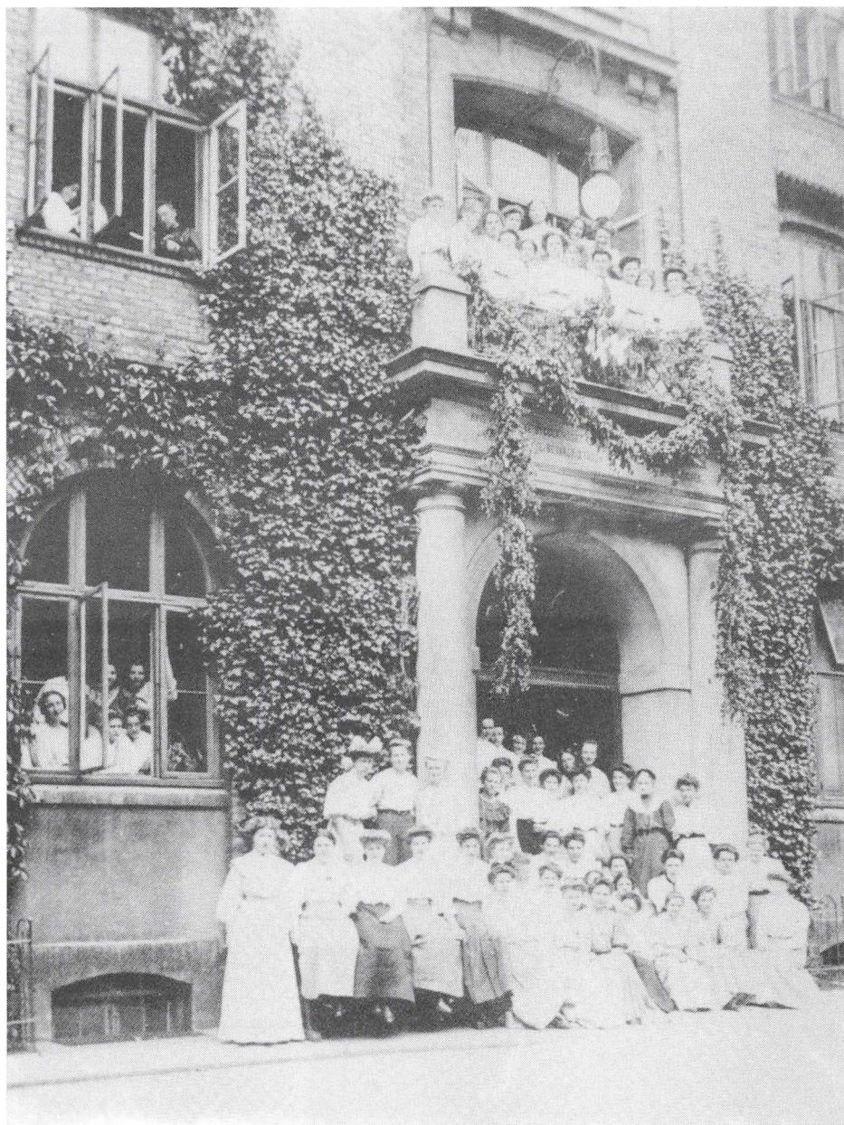
Eleverne formelig vælter ud af hoveddøren til N. Zahles Skole, – et sindbillede på den succes, som den ældre Natalie Zahle ved sin fratræden kunne notere for sin skole, 1900.