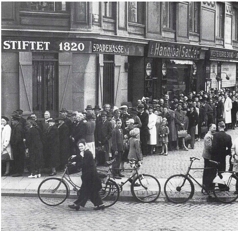
Pengeombytningen den 23. juli 1945 gav anledning til lange køer uden for landets pengeinstitutter. Sparekassen på Istedgade i København var ingen undtagelse.

fælle, skulle ægtefællens navn og adresse anføres.