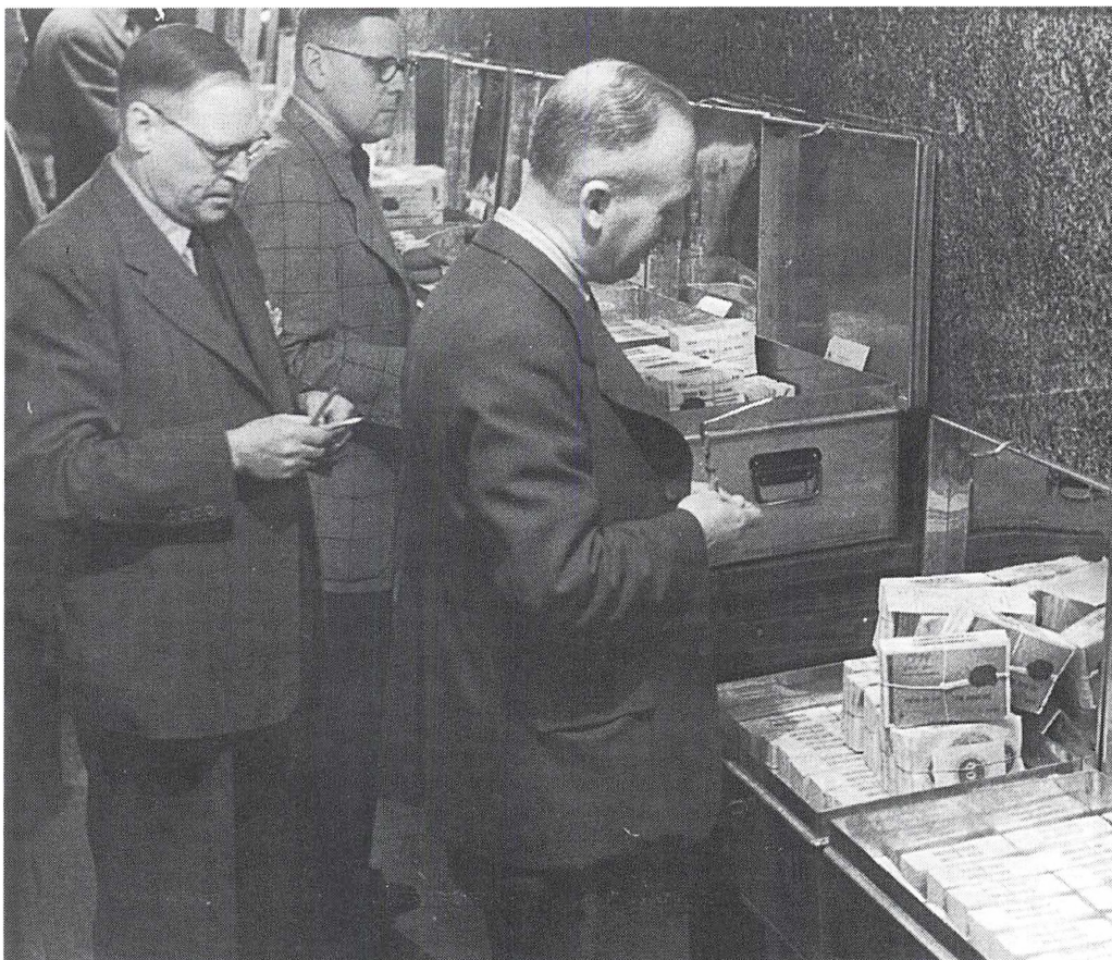
Pengeombytningen den 23. juli 1945 betød en øjeblikkelig reduktion af seddelomløbet på 300 mill. kr. Her anbringes nogle af de indkomne sedler i store bokse.

I hele perioden inddrog skiftende regeringer knap 3 mia. kr. i håb om at nedbringe likviditeten og dermed tilpasse danskernes købekraft til landets økonomiske situation.