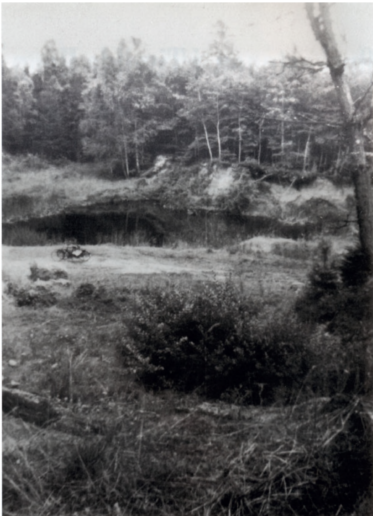
Udsigt mod søen. Til venstre i billedet står to cykler parkeret og foran dem ligger ønskes- tenen. august 1943.