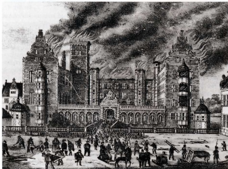
Frederiksborg Slots brand den 17. december 1859.