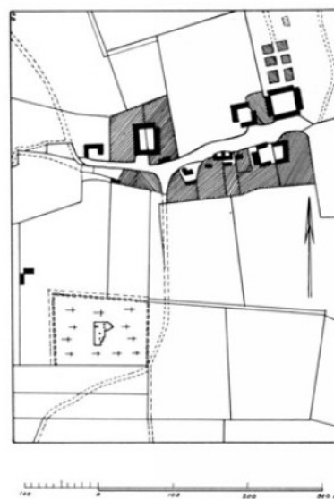
Hundslund by 1:10.000, målt ved udskiftningen 1791.