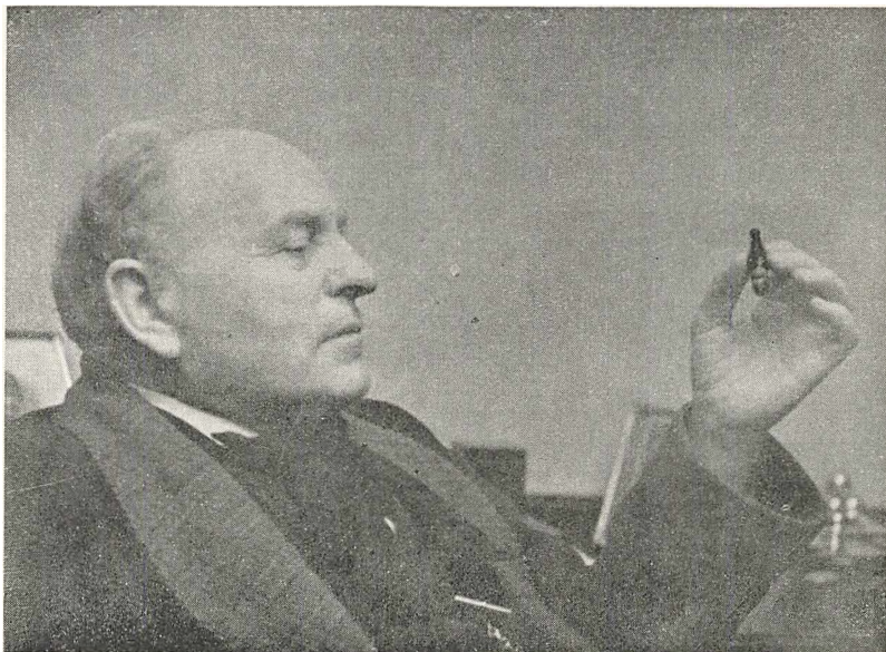
K. Steensen. Fotograferet 1933 af Emil Orris.