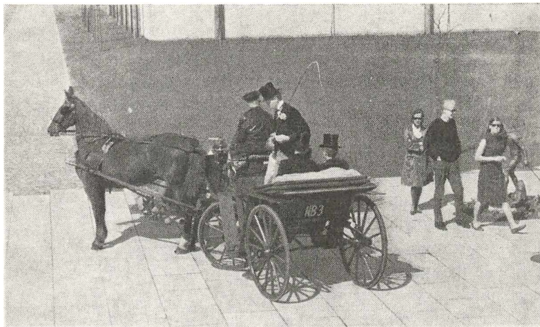
Censorerne ankommer til „Højere Dimis“.