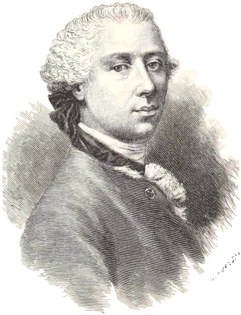
Jens Schelderup Sneedorff.