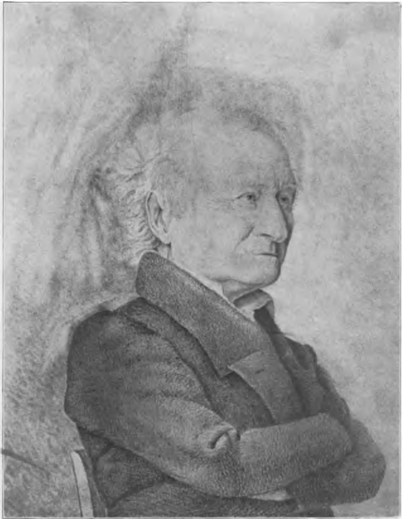
KNUD LYNE RAHBEK.