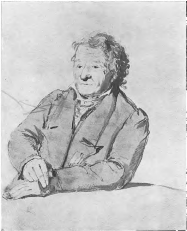
KNUD LYNE RAHBEK.