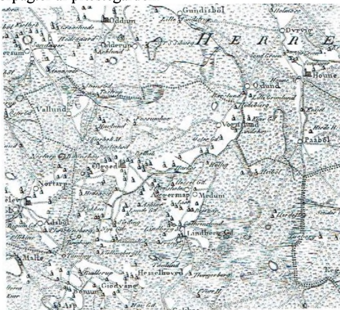
Videnskabernes Selskabskort 1803, udsnit over Ølgod sogn.