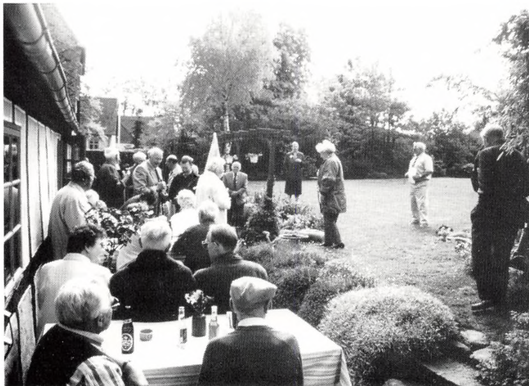
Formiddagsøl på Ryttergården