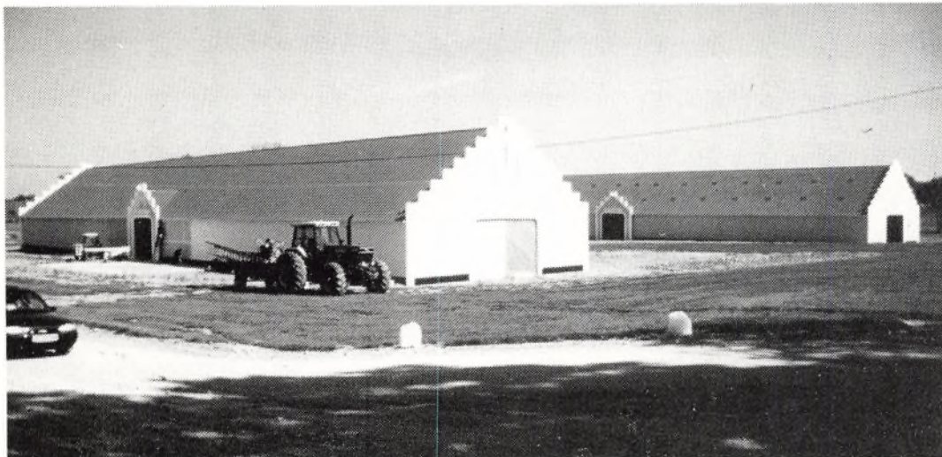
Aakærs nye landbrugsbygninger.