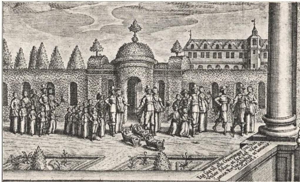
Forklaring til Billedet omstaaende.