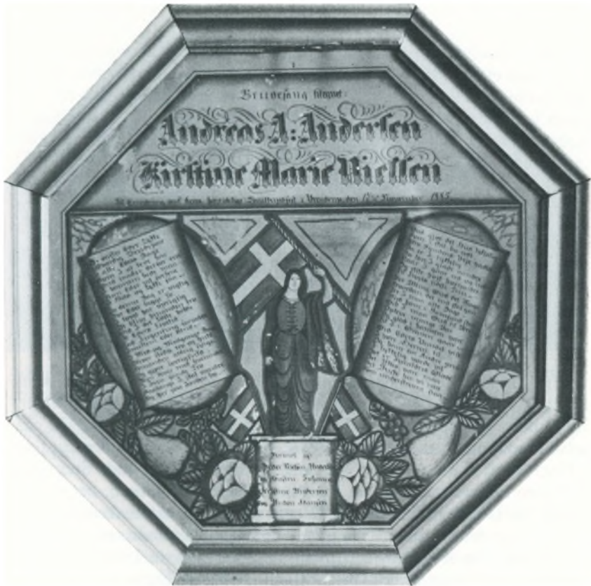
Brudesang fra 1885, malet af Hans Chr. Autrup. (Billedet er nu hos fru Olga Kirkegård Jensen, Helle plejehjem).

til Slut henvendt til Foreviserne – men hvorledes – idet Bispen pegede paa de forskellige Ting – dette maa have været særlig bekostelig for dem, her i Sognet findes vel næppe en Mand, som har kunnet paatage sig Arbejdet. Man pegede paa Far – der staar Manden!