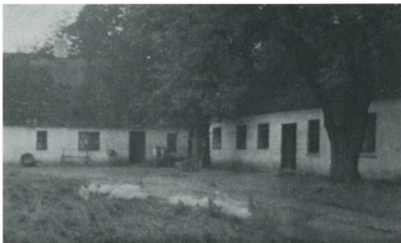
Ravnshø fattiggård. (Tidl. præstegård til Vester Nykirke og Fåborg). (Foto i Fåborg lokalhistoriske arkiv).

Efter 9 Dages Ophold paa Gaarden kom han, og dermed Forløsningen. Han havde skaffet mig en Plads, og der kunde jeg maaske blive altid, blot