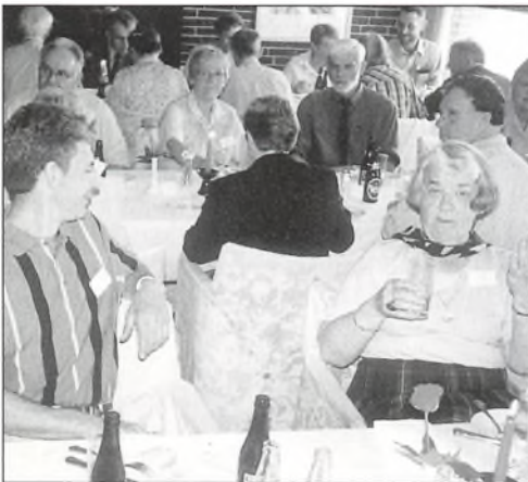
Fra frokosten på Hotel Griffen