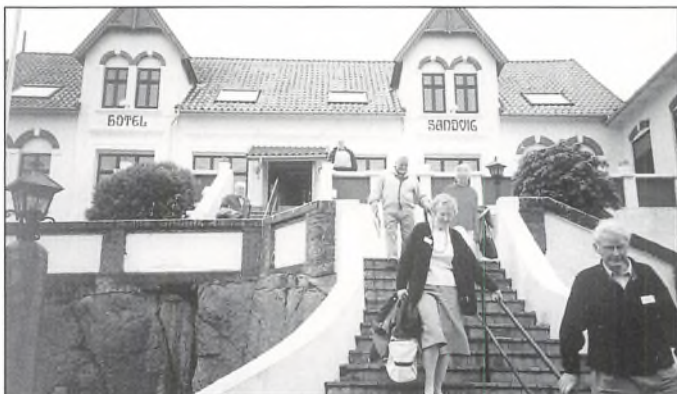
Fra hotellet i Sandvig

bage - og det er vist i begyndelsen af 1700-tallet, har heddet Bak. Så derfor skifter jeg ikke navn til slægtsgårdens navn.