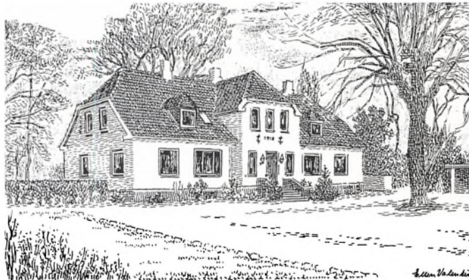
Højstrupgård tegnet af Ellen Valentin.

Stuehuset var af egebindingsværk med stråtag. Udlængerne var dels af kampesten, dels grundmur. Nogle med stråtag andre med tegltag.