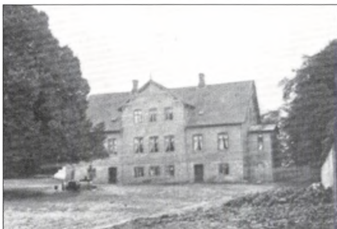
Ingvorstrup o. 1900.

I 1773 var Ingvorstrup gods på godt 2200 tdr. land, men i 1868 blev al bøndergodset frasolgt. I 1914 frasolgtes yderligere syv ejendomme, og Ingvorstrup fik sin nuværende størrelse på 120 ha.