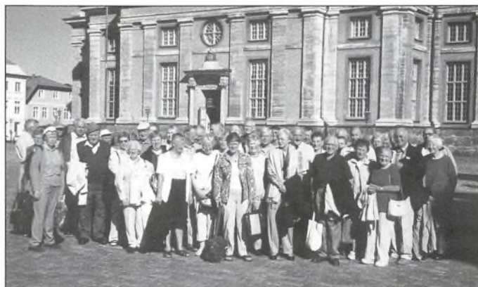
Hele rejseselskabet foran domkirken i Kalmar.