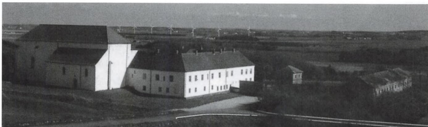
Børglum Kloster. Bygningskomplekset fra middelalderen domineres af de tidligere dom- og klosterkirke, der nu er sognekirke.

Når TV2's julekalender til december samler hele nationen vil et hvert barn igen vide, hvad Børglum Kloster er.