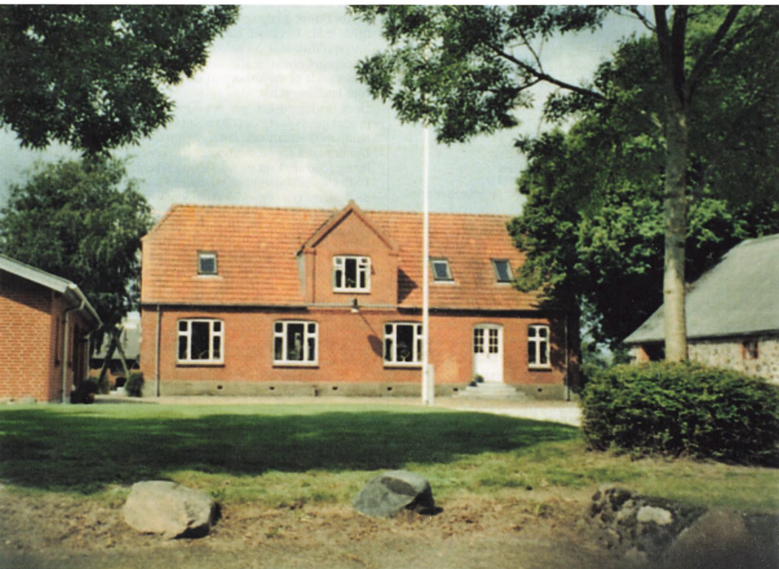
Vrouetoftgård syd for Skive