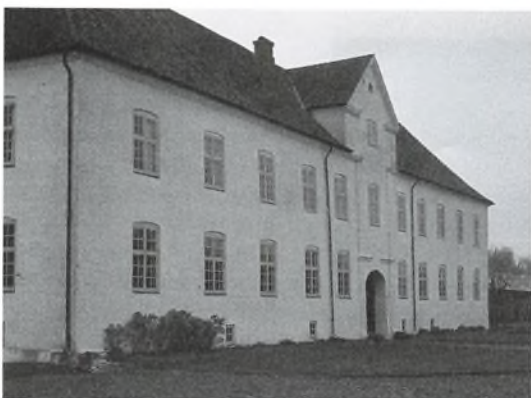
Børglum Kloster. Sydfløjen der står som da arkitekten Lauritz de Thurah ombyggede det gamle kloster i 1740'erne.

Slægten Rottbøll, der siden 1835 har ejet Børglum Kloster, har navn efter en nedlagt hovedgård i Lodbjerg sogn i Thy. Slægten kan føres tilbage til 1600-tallet.