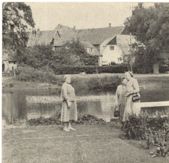
Årsmødedeltagere i Ribe.