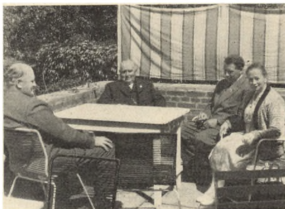
Et hyggeligt hjørne i »Munken«s have.

Meddelelse fra amtsstuen om ejendommens grundbeløb er det også vigtigt at have liggende. Grundbeløbet bør