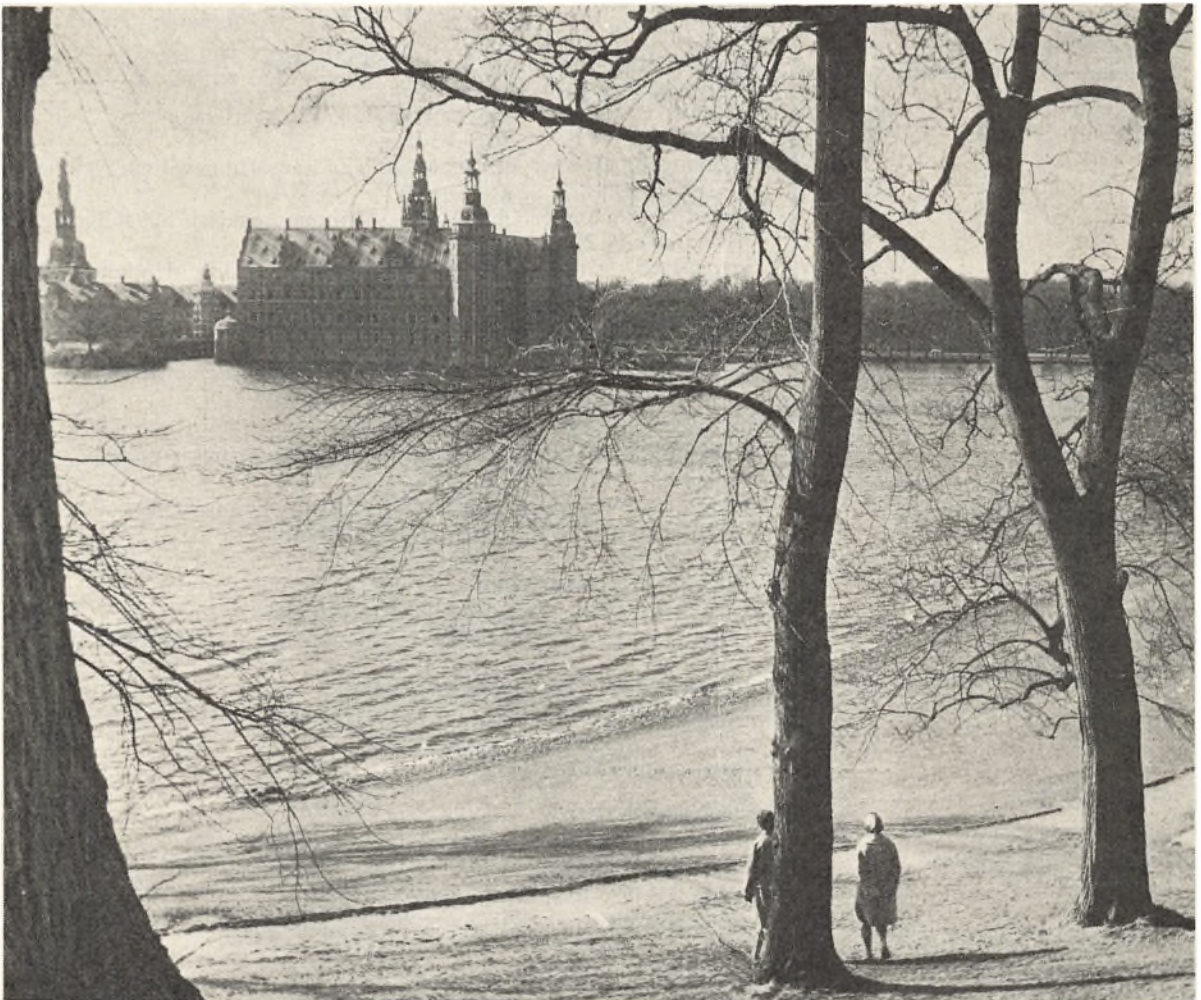
Frederiksborg Slot.