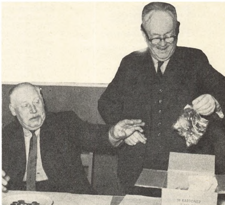
Gammelt billede af oldermanden, der tæller spurvehoveder ved grandelagsmødet, en skik, der er udløbet.

i laugsprotokollen. Indledningsvis berettes om vejrforhold og efterfølges af en redegørelse om landbrugets forhold herunder arbejdsvilkår, afgrødernes vækstbetingelser og om høstudbyttet. I nyere tider får landbrugspriser og markedsforhold en særlig omtale. Så berettes om indtrufne begivenheder i byen, dødsfald, fødsler, vielser og om tilflyttere til byen, og hvad der ellers er sket af særlige tildragelser.