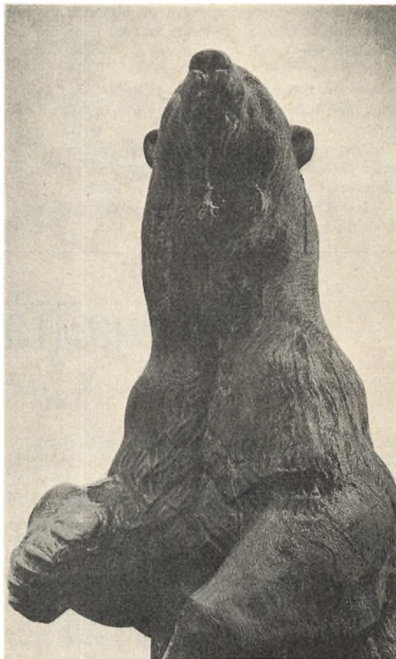
Holger Wederkinchs isbjørn i »brystbillede«, 1913, skænket af anonym giver.

Kragen i træet på Kastelsvolden – ravnens fæter – minder os om, at brutalitetens metoder muligvis er blevet moderniseret i mellemtiden, men kynismen og blodtørsten rundt om på vor klode er stort set den samme. Andres lidelse er fremdeles i visse kredse et yndet nydelsesobjekt.