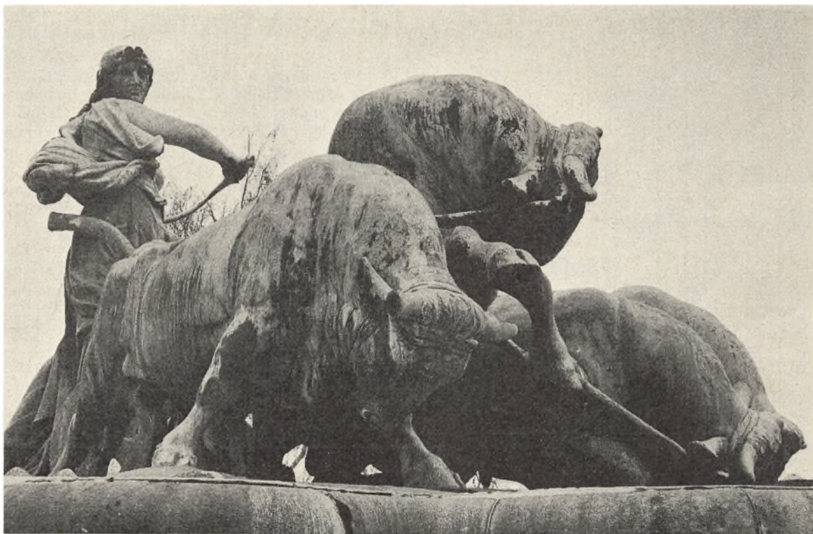
Gefionspringvandet lavet af Anders Bundgaard og afsløret 1908. Samme kunstner lavede bl. a. også Cimbretyren i Ålborg.

Langelinie er barsk en lørdag i den lille, bidske februar. Længere fremme i miljøet, ude på selve Langeliniekajen, hvor i højsommeren fremmede orlogsskibe og turistcruisere lægger til, står en enlig fisker med sit grej, sin cykel, madpakke og termokaffe. Meget opløftet ved konfrontationen med en anden af sin race, forekommer han ikke at være, men heller ikke egentlig uvenlig i svaret på spørgsmålet: – Fanger De noget?