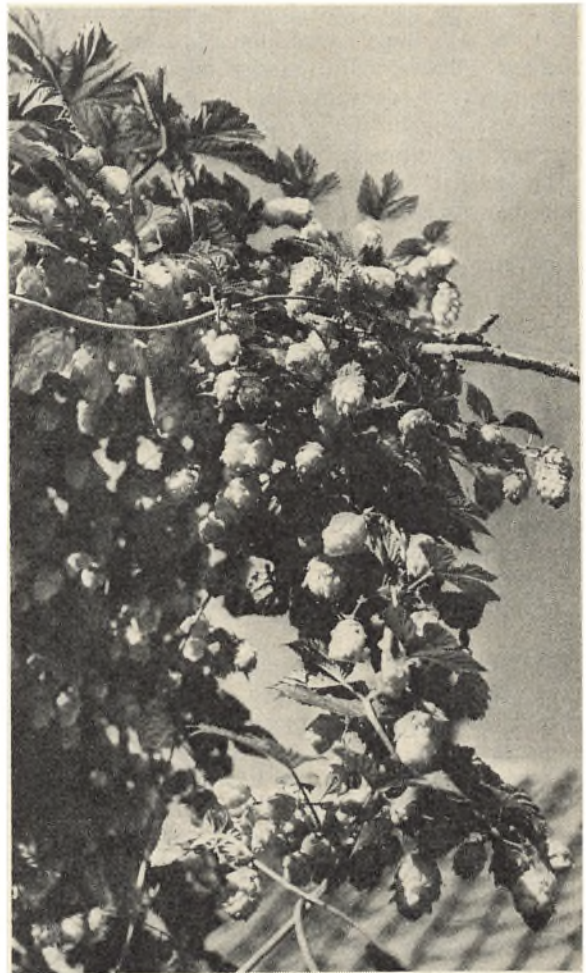
Humlen er en ældgammel kulturplante, som har været brugt til mange formål langt tilbage i tiden, bl. a. til ølbrygning. I en nordfynsk have står et udgået gammelt frugttre begroet med humle i seks-syv meters højde. Det var i sommer fyldt med humlekopper.