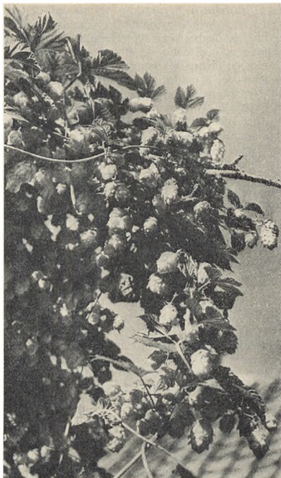
Gammelt træ begroet med humle

I sommerens løb var de ru humleranker skudt op omkring hvert eneste nordfynsk hjem som en skov. De blev til en mystisk, duftende, halvmørk jungle, hvori drengene havde deres kæreste tumleplads. Når knopperne modnedes om efteråret, blev hele skoven fældet i løbet af et par dage.