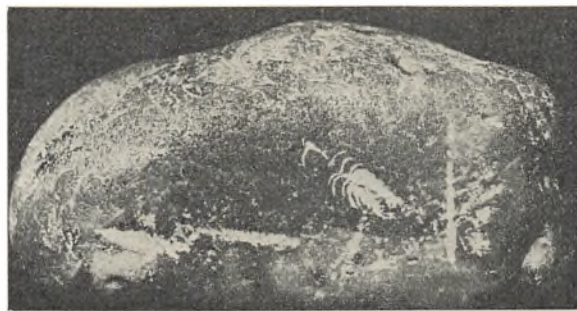
Flintknolden med tegningen af den fiskende hejre.

DET ER LET i trafikbilledet at se, hvem der bevæger sig med rytmesans eller slet ikke. De sidste opfatter overhovedet ikke færdselsrytmen, mæsser sig bare frem og fremkalder mere eller mindre ubekvemme situationer, om ikke det, der er værre. Trafikrytmen forudsætter, at man bevæger sig smidigt og opmærksomt og føjer sig ind i situationen. Alt for mange med førerbevis ejer ikke den form for musikalitet. Motorførere af den type voldtager også ofte deres motorer. Man bør kunne høre på en motor, om den befinder sig godt ved det, man foretager sig med den. Det er billigst i det lange løb, men det gør det også morsommere at køre under alle forhold. Ethvert fæ kan ødelægge. Psykisk modvirker musikalitet ved rattet, på motorcyklen og cyklen voldsmentaliteten i trafikken, den, som er dødsens farlig, fordi vold under alle normale omstændigheder er af det onde. En dame, kommet hjem fra flere år i udlandet, sagde forle-