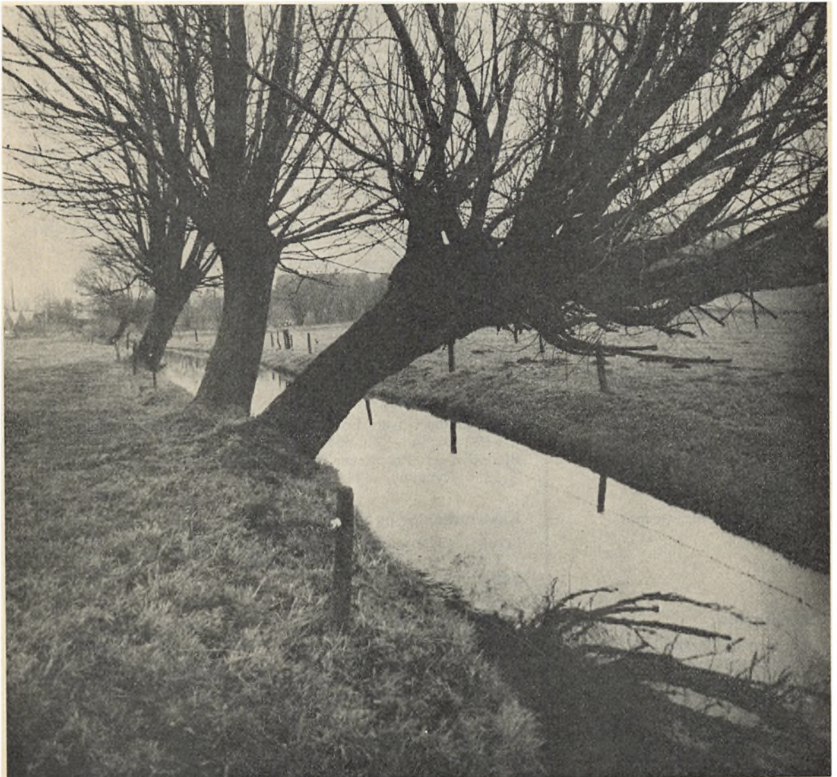
Decemberstemning ved Rågelund Å, Fyn