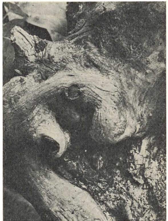
De stærke rytmer i en frønnet træstub.

Er vi indbyrdes blevet mere rytmesløve og min-dre musikalske over for hinanden i dette forure-