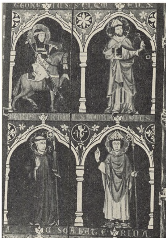
Parti fra relikvieskabet i Løgumkloster