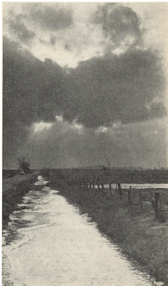
Græsareal med afvandingskanal