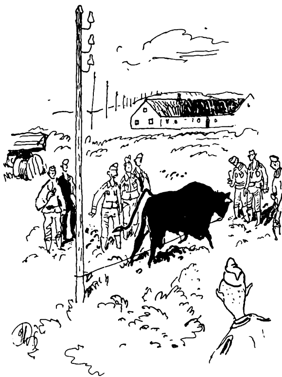
Snart stod 14 tyskere i en cirkel uden for tyrens bane.

Derefter trak han sig i god orden tilbage til gården og satte sig ind i en stue, hvorfra han kunne se, hvad der nu ville ske.