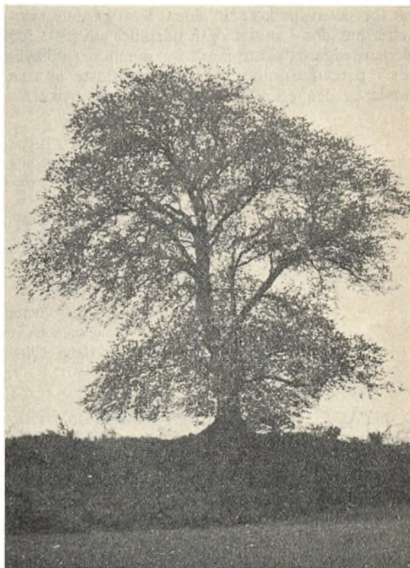
Værnetræ ved gården »Egelund«, Gamby, Fyn.

og Fyn. Kun få træer er registreret på Sjælland, i Nord- og Vestjylland. På Sjælland tillægges man derimod bestemte træer beskyttende egenskaber mod sygdom og anden ulykke.