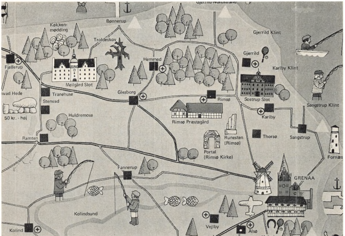
Dette kortudsnit fra Djursland skulle give Dem mulighed for at følge med på søndagsudflugten. Fra Grenå mod nord til Sostrup Slot, hvorfra der køres mod vest.

Gårdejer Johs. Jørgensen, »Rejstrupgård«, Juelsbergvej 2, 5800 Nyborg.