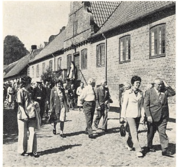
De mange gæster forlader Sostrup Slot, som var en oplevelse.