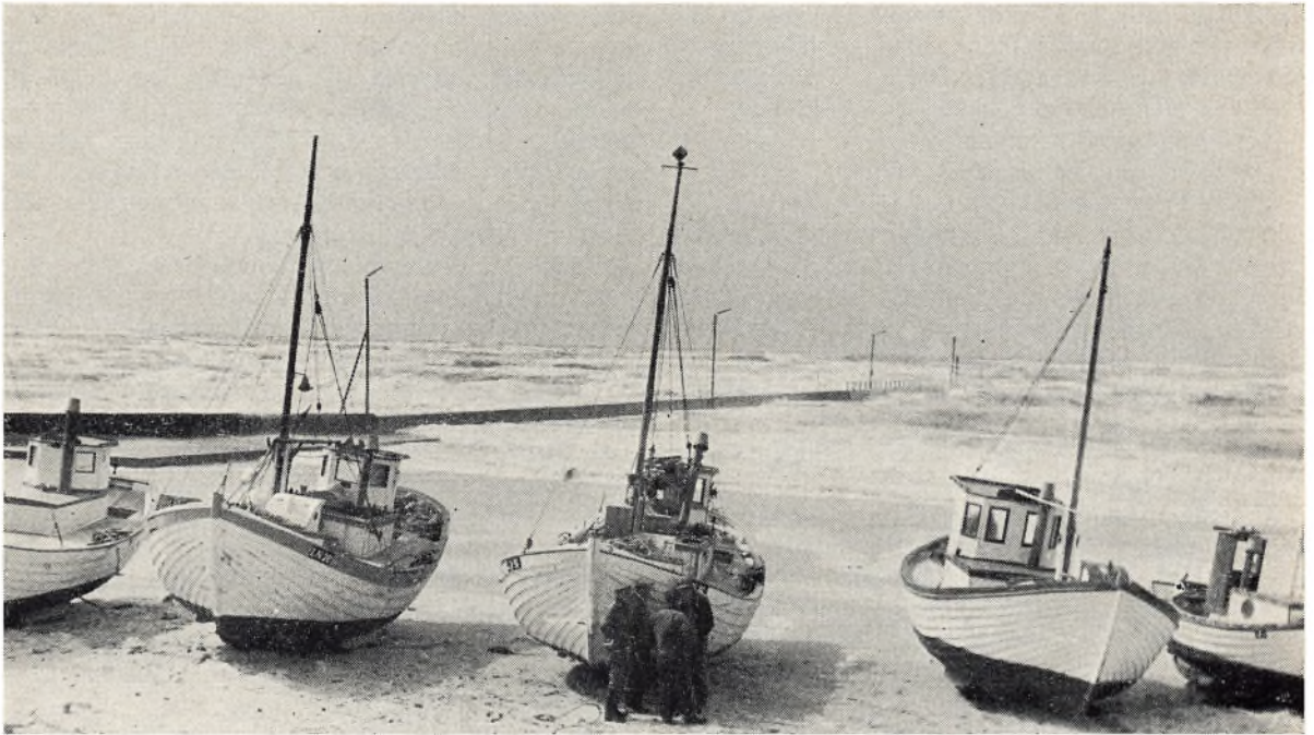
Motiv fra Løkken Strand med den karakteristiske oplægning af fiskekutterne på strandbredden.