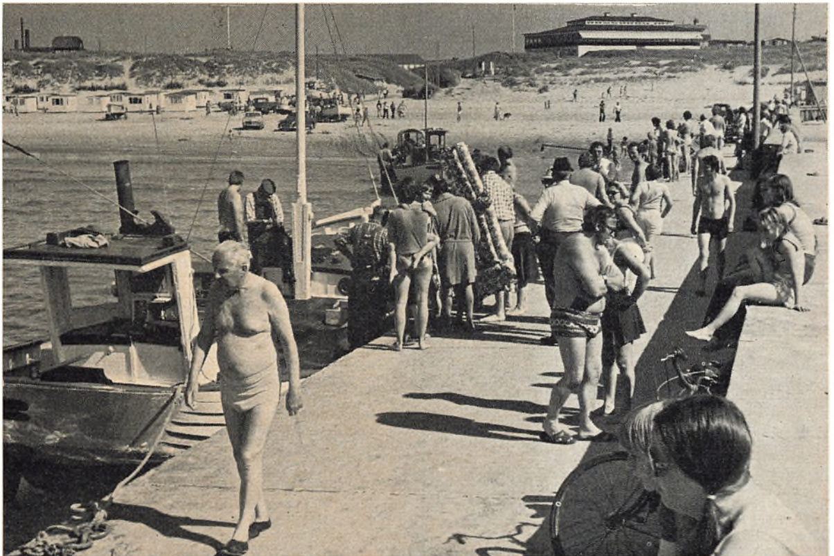
Turisternes yndlingssted – molen – med restaurant »Strandpavillonen« i baggrunden.