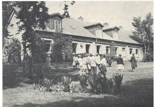
Hjortnæs fra havesiden