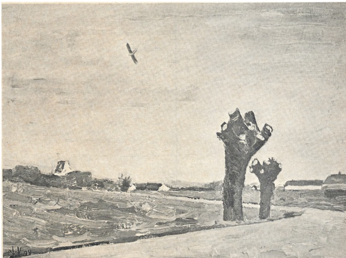
Efter maleri af William Hansen (se side 3).