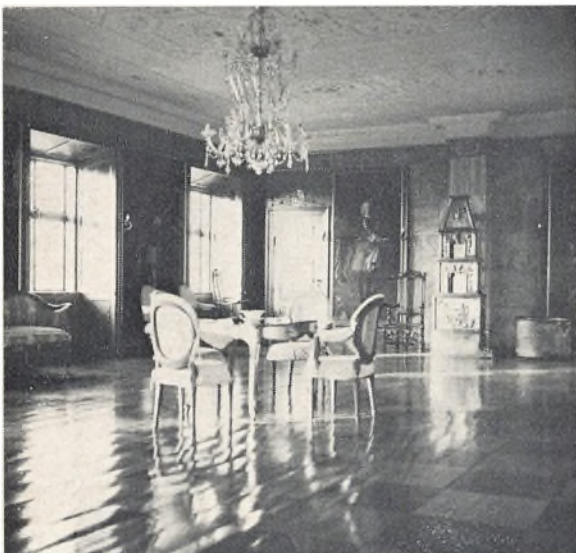
Kongesalen på Børglum