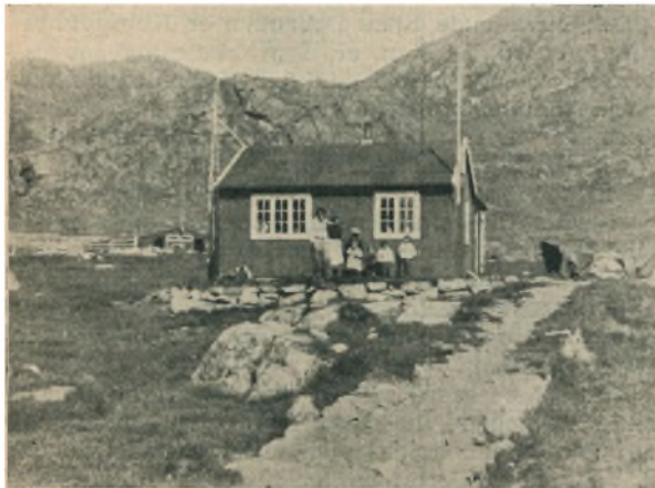
En grønlandsk Nybygger og hans Familie foran deres Hus. 46.