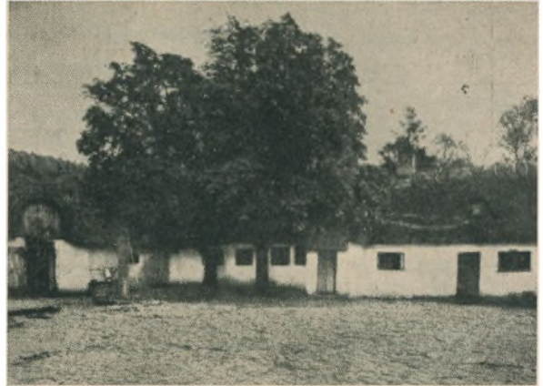
Midtjællandsk Fæstegaard fra Udskiftningstiden.