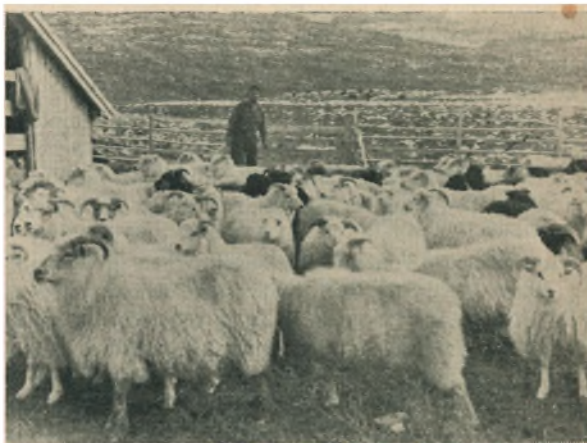
Faarene samles ved Efteraarstide. Forfatteren fot. 45.