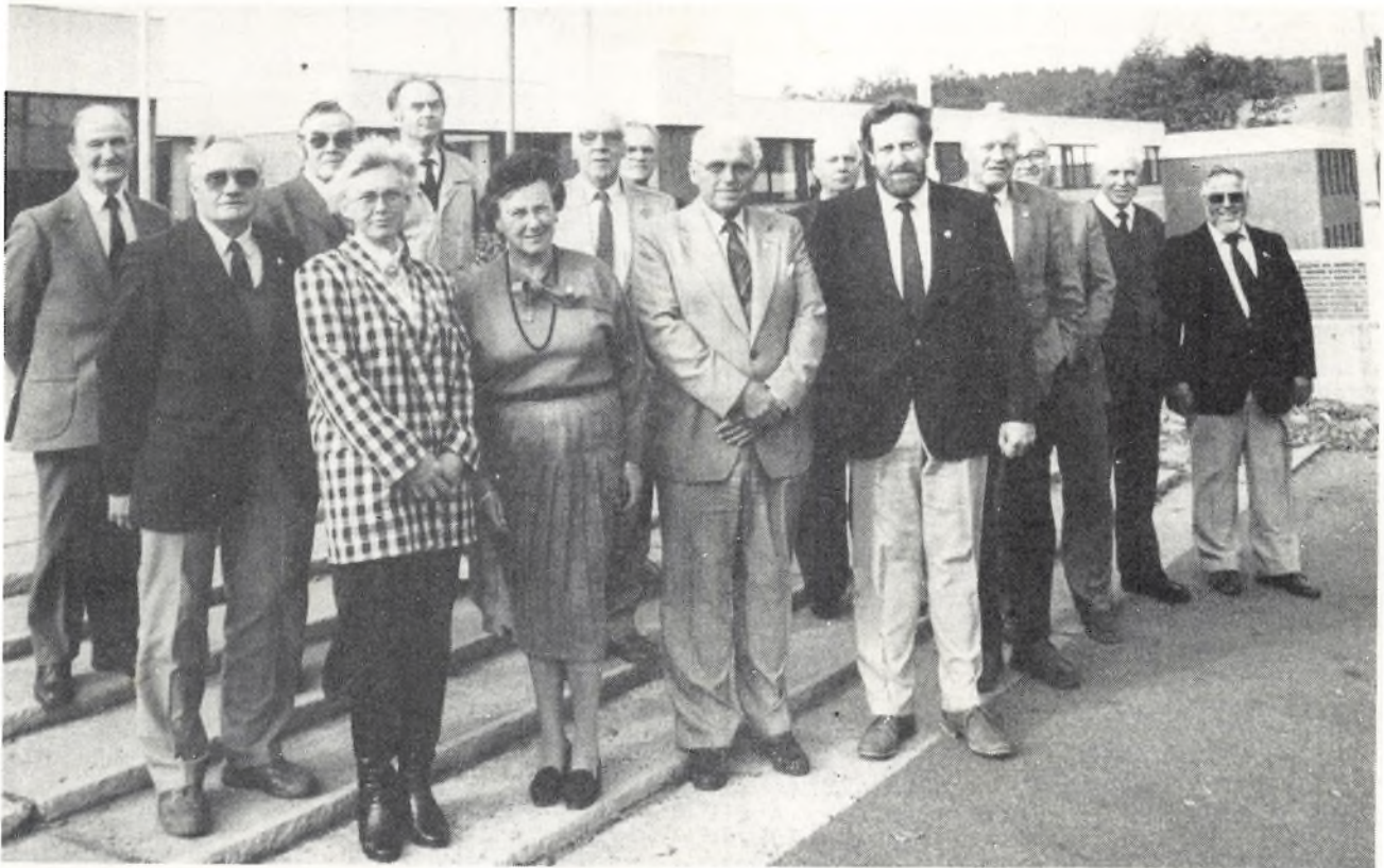
Hovedbestyrelsen fotograferet den 20. oktober 1987 foran Vingstedcentret.