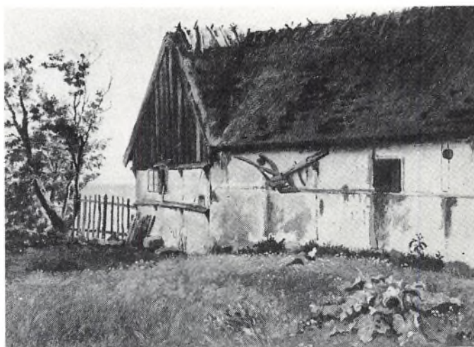
J. Th. Lundbye: Ulstrup. Refnæs. 1847.

Bagi bogen er der foruden en omfattende litteraturliste om kunst og landbrug en registrant over nogle af de mange, mange flere danske malerier fra tiden, hvor landbruget er blevet skildret. Mange af billederne hænger for øvrigt på kunstmuseerne uden for København.