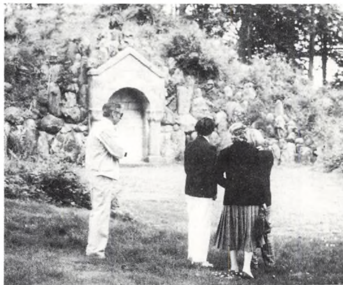
Gravkapellet i parken til Skovsgaard.