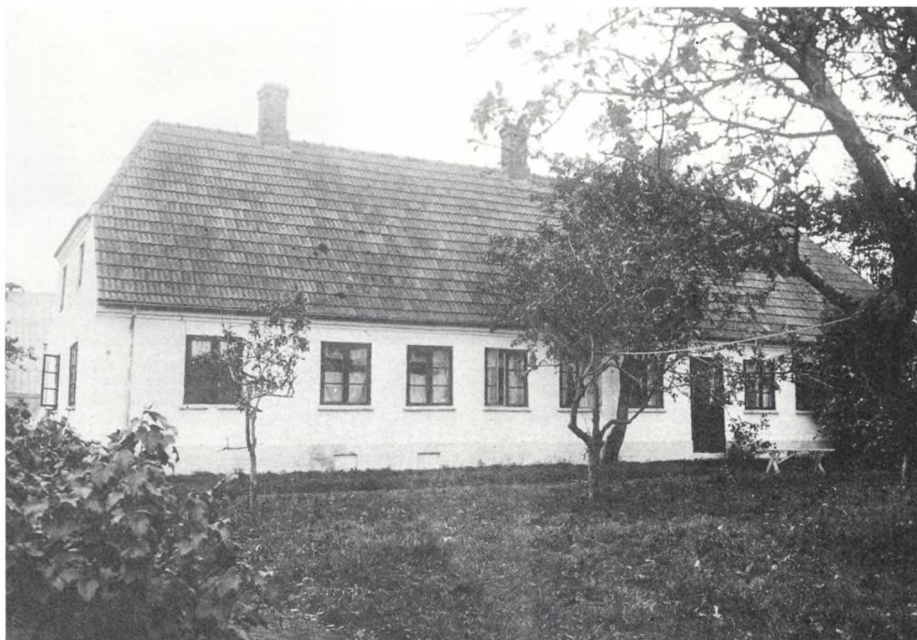
Dalsgård ved Løsning. (Foto fra 1934)

December 1987 - Januar 1988 Nr. 271 - 46. årgang