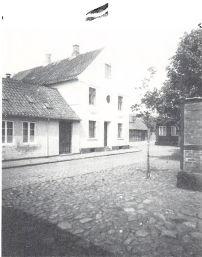
Købmandsgården i Rønne. (Fotograferet 1935.)