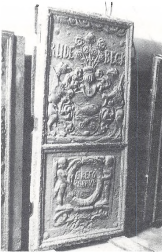
Gavlstykket af jernkakkellovnen, der er nævnt i skiftet 1754. (Bornholms Museum).