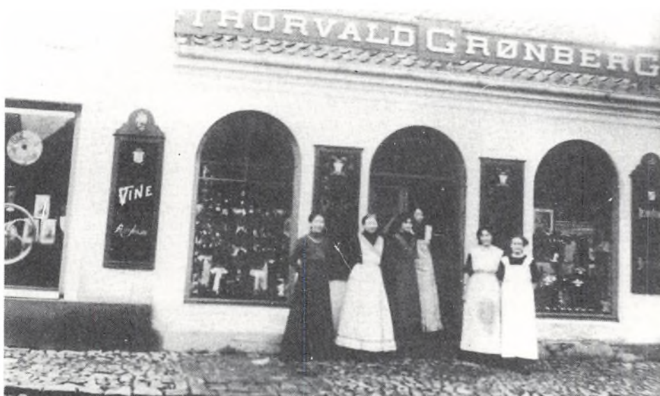
Personalet fotograferet foran butikken ca. 1910. Vinduerne er pyntede med store sløjfer, grankviste og Dannebrogslag.

Årh med bildt = plov med skær Herberghus = salen