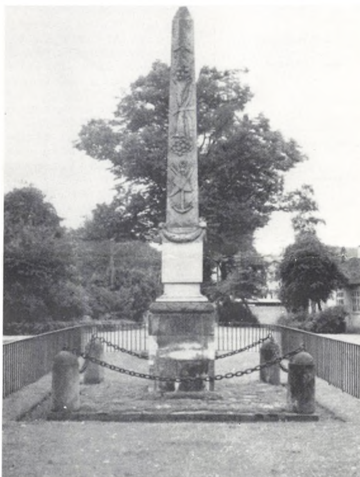
Stolbergstøtten ved Hørsholm. Danmarks ældste monument over landboreformer. Rejst 1766.