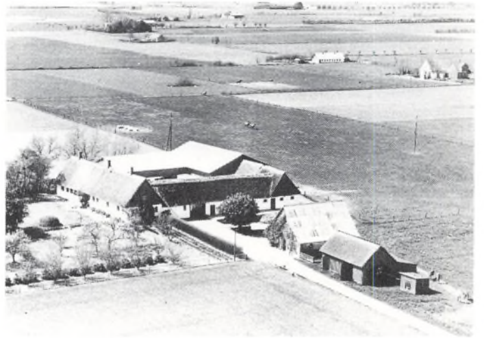
Brønstedgård 1935. Matr. nr. 11 a, Vålse by og sogn.

Bygningerne bestod i 1692 af 2 længer: et alhus (dvs. beboelse og stald i eet hus) på 13 fag og en lade på 3 fag. I 1741 var der 3 længer: alhus på 11 fag og to udlænger på hhv. 7 og 5 fag – alle i forholdsvis ringe stand. Bygningerne ændrede sig næppe meget den resterende tid, de lå i byen. Ved udflytningen 1800 eller 1801 opførtes en ny firelænget gård på 48 fag. Det var også ved denne lejlighed, at gården fik sit navn – opkaldt efter den ås, hvorpå den blev flyttet ud.