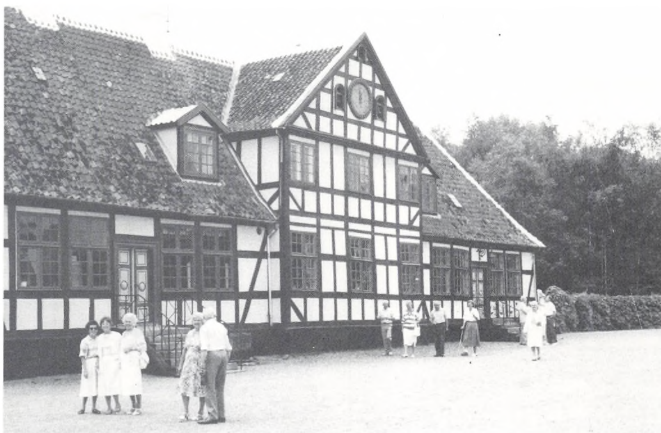
Søvertorp, Langeland. Gården blev oprettet, da kong Frederik den Anden lagde flere gårde sammen. Hovedbygningen er delvis fra den tid. Hovedbygningen og den gamle park er fredet.