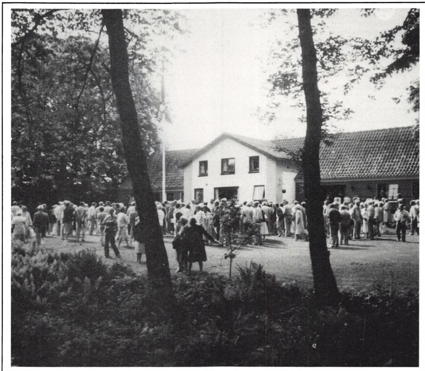
Årsmødedeltagerne samlet i haven til Saksager.