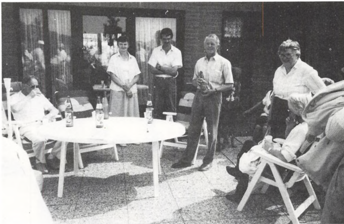
Familien de Visser og hans danske gæster

de Visser har to sønner, som skal overtage bruget. Denne familie er også kommet fra Sydholland, men den har forpagtet jorden for 40 år, og på denne gård, er bygningerne gårdmandens egne.