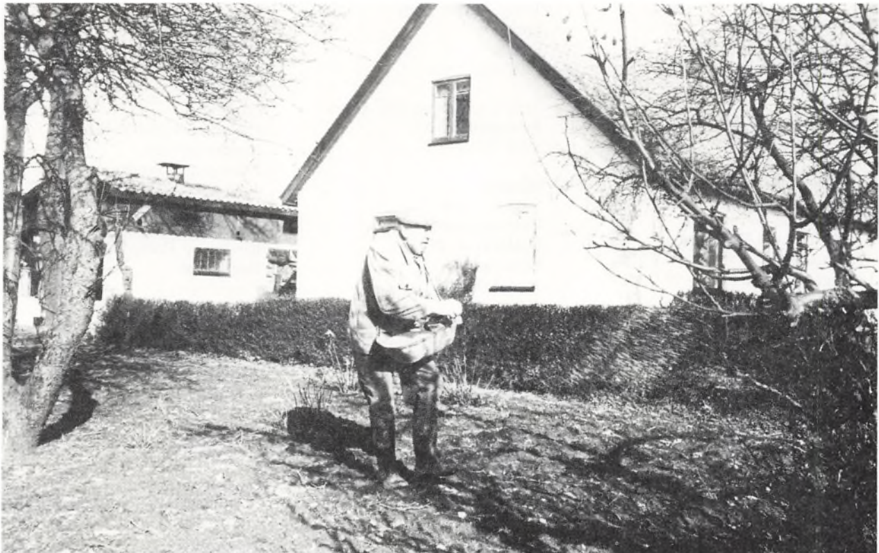
Forårsarbejde på en mindre gård i 1987.