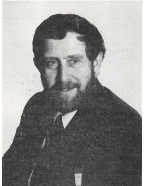
Badstrup, den 29. maj 1989

Må jeg på denne plads hermed bringe en stor tak til alle, der deltog i årsmødet i Vendsyssel. Tak fordi I alle medvirkede til, at vi atter i år fik et uforglemmeligt årsmøde.