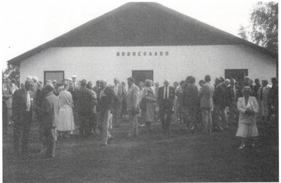
Årsmødedeltagerne samles foran Buddegårds moderne udlænger, opført i 1978 efter brand.