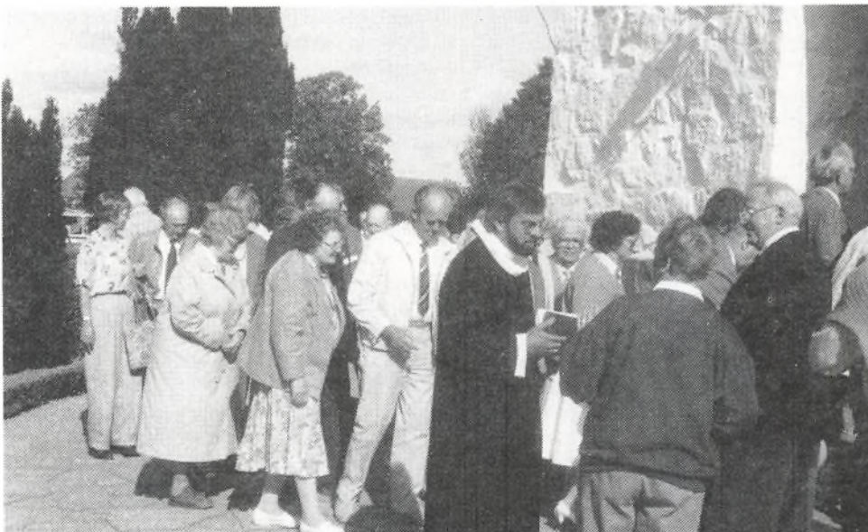
Årsmødedeltagerne ankommer til Østerlars Rundkirke.

Da årsmødet havde budt på god forplejning udbrød formanden for Himmerlandskredsen: Den bedste tid er måltidet!