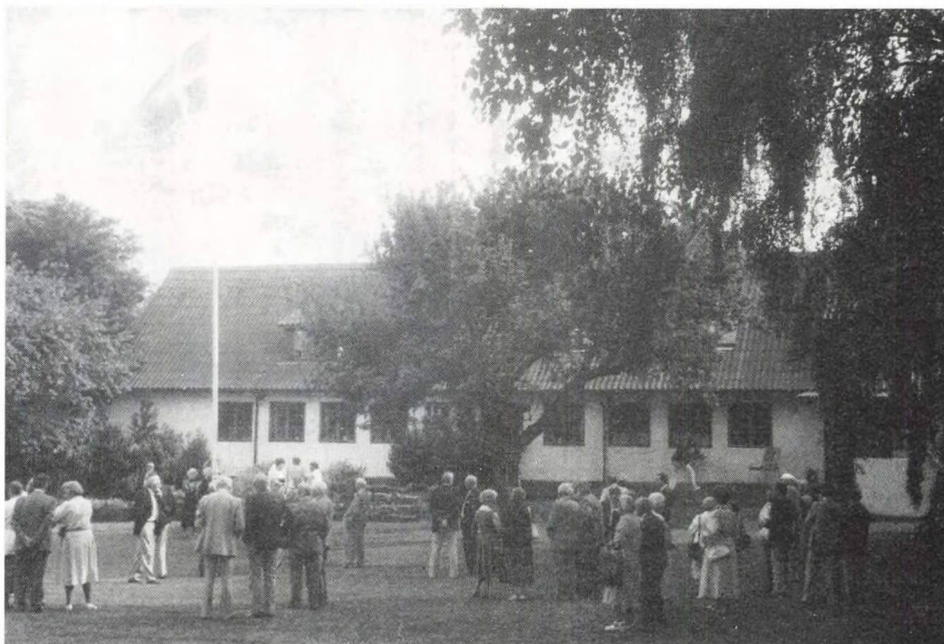
Buddegård ved Nexø. Gården har i år været i slægten i 400 år, og det blev den 23. maj markeret med slægtsgaardsforeningens besøg.

SLÆGTSGÅRDEN LÆR AF FORTIDEN - LEV I NUTIDEN - VIRK FOR FREMTIDEN