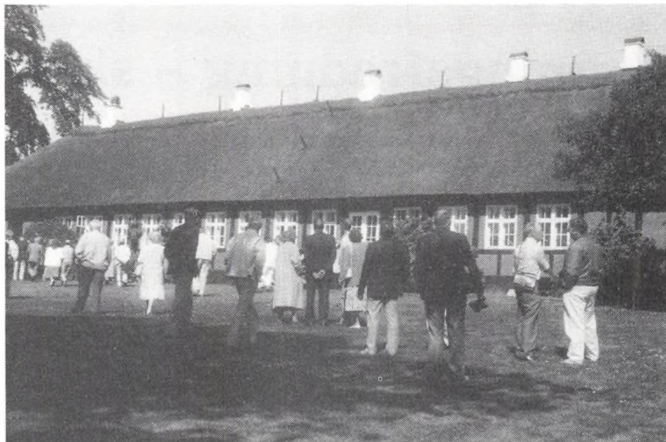
Efter gudstjenesten i Østerlars Rundkirke blev der lejlighed til at betragte den smukt vedligeholdte præstegård.