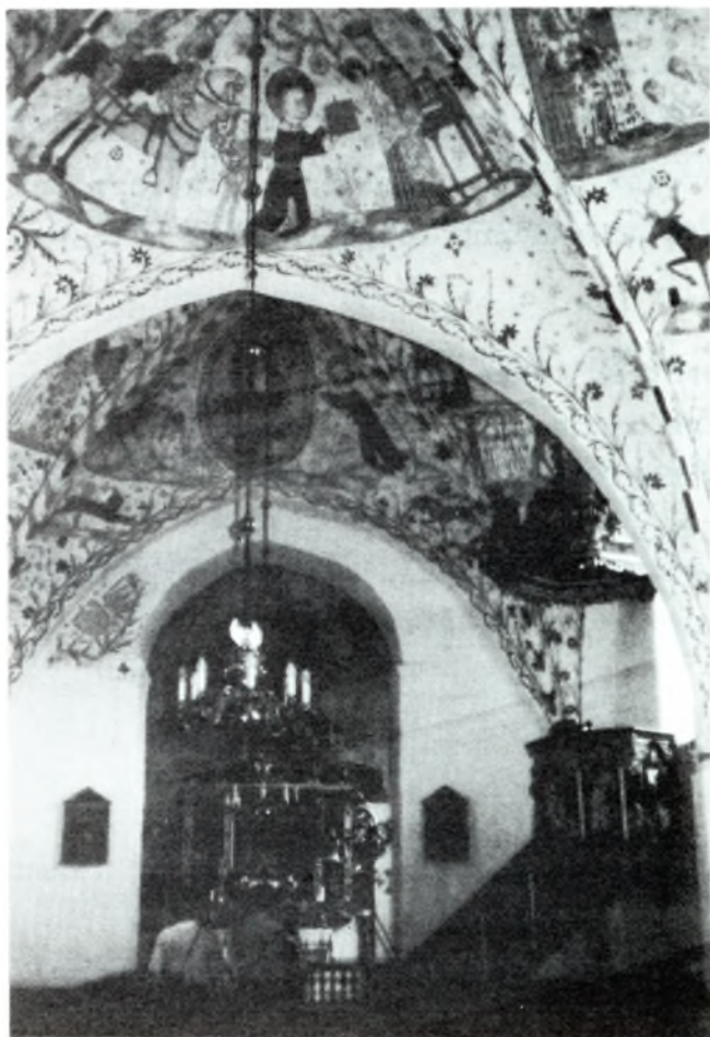
Et udsnit af kalkmalerierne i Fanefjord Kirke.