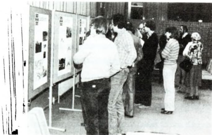
Fra åbningen af udstillingen "Værd at værne".

Endelig vil vi nævne, at skoler eller andre interesserede er velkomne til at låne hele eller dele af udstillingen, som består af 6 plancher.