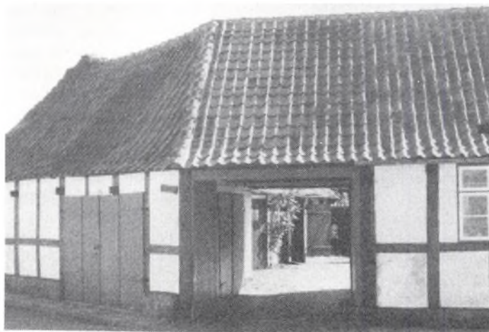
Gården set fra Kandegade

dragon Holm til at påtage sig faderskabet til Karens barn.