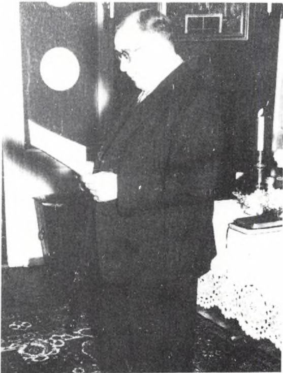
Sognefogeden som vielsesmyndighed.

Sognefogeden skulle våge over den gode orden og sædelighed samt søge at afværge alle mulige foreteelser, som kunne true den offentlige moral. Forordningen nævner: anholdelse af løsgængere og fremmede betlere, afværgelse af drikkeri og slagsmål, anholdelse af folk, der holdt kro eller brændte brændevin ulovligt.