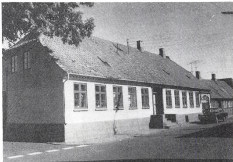
Søndergade 21 med hovedtrappe af granit. Fiske- og vildthandel i ejendommens sydligst beliggende fag