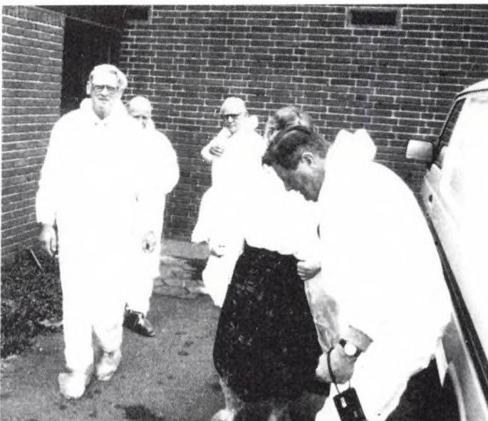
Iført hvide dragter og overtræksstøvler kan man bese Tybjerg Kontrolhønseri