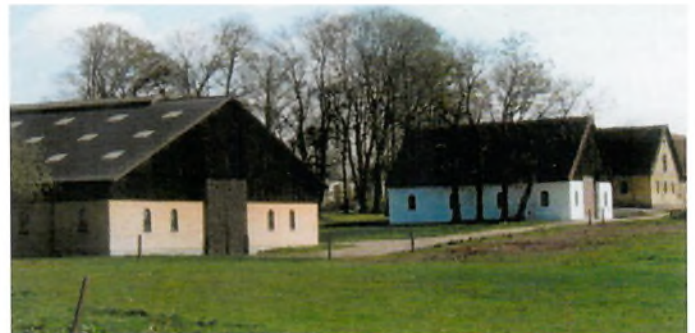
Birkemosegård set fra Lejregårdsvej. Bagest ses de gamle længer, midt i den retablerede staldlænge, der væltede i stormen 199 og nærmest de store staldlænge. Bemærk vinduerne i de to ny længer er indentiske med vinduerne i de gamle længer.

Bygherren har gjort sig særdeles grundige overvejelser over placeringen af den nye avlsbygning, der både har omfattet forholdet til det eksisterende gårdanlæg, og den relativt store nybygnings placering i det åbne landskab, hvor den ligger højt placeret og synlig i vid omkreds. Overvejelserne har resulteret i et møde mellem nyt og gammelt i et ualmindeligt helstøbt anlæg, hvor hver enkelt bygning, uanset forskellig alder og kvalitet i øvrigt, har sin indlysende plads i det samlede ensemble, som gården udgør. Især hæfter man sig ved