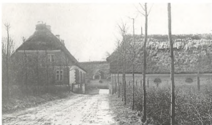
Kalmargård o. 1900.