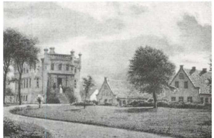
Benzonsdal o. 1875.