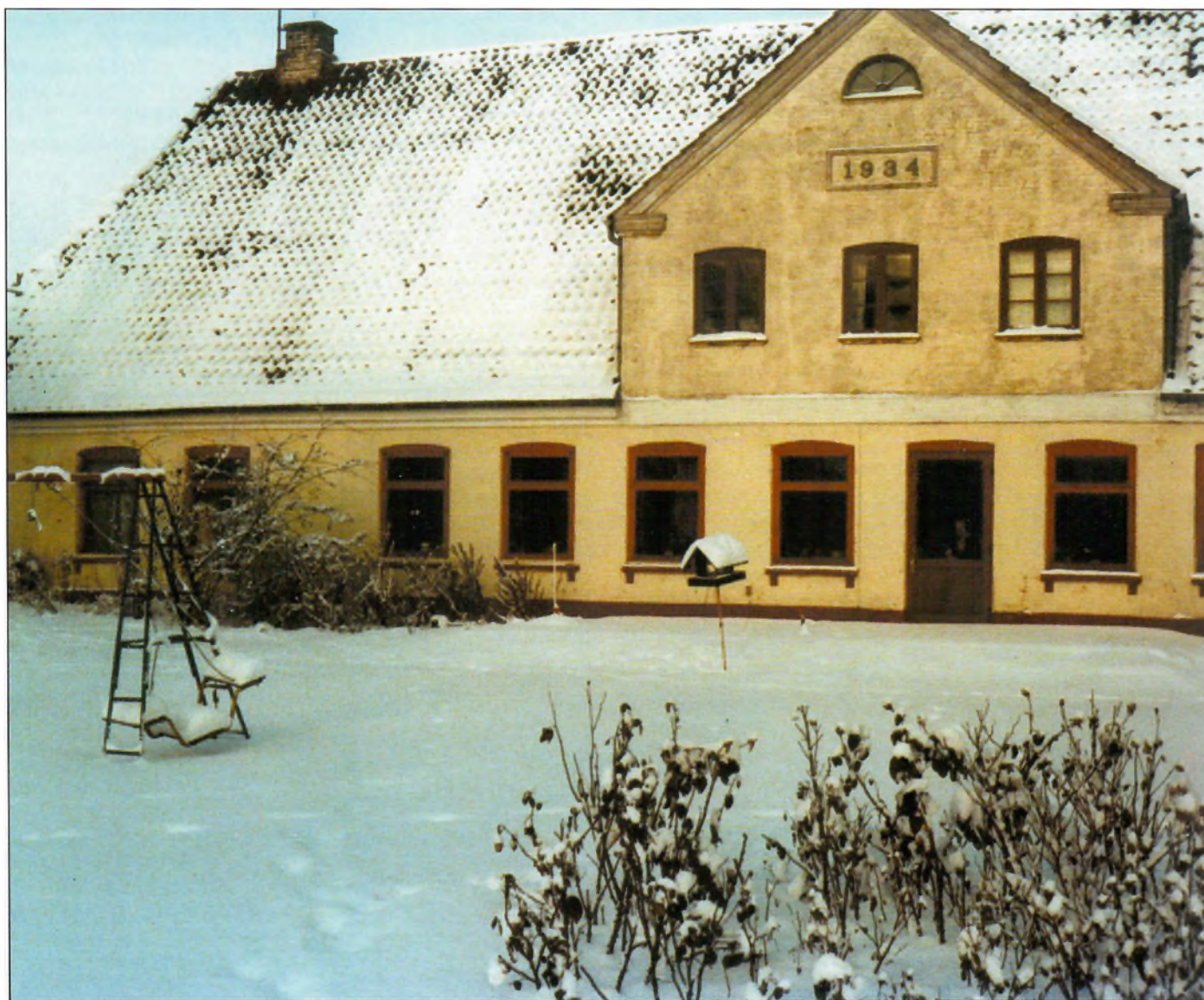
Kalmargård ved Haderslev. Det gamle stuehus blev revet ned i 1979.