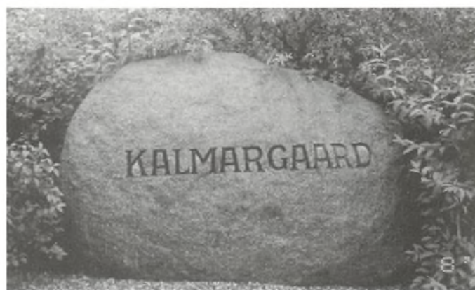
Ved udgravningen til den nye gårds bygninger, dukkede der en meget stor sten frem. Den står nu ved indkørslen med gårnavnet.

Af andre begivenheder i de år, kan nævnes at i 1949 blev det første stykke hundegræs høstet med mejetærsker. Mejetærskeren var fra Andelsmaskinstationen i Haderslev. Det var så stor en sensation, at alle eleverne fra Marstrup skole fik lov