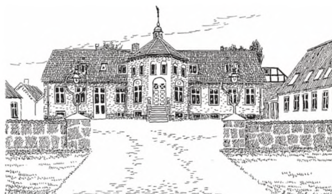
Østergård tegnet af Ellen Valentin. Den prægtige hovedbygning er opført i 1878.