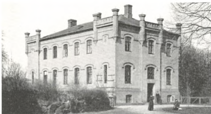
Benzonsdals hovedbygning o. 1900.