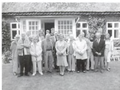
Arvingerne og "den nye ejer" på trappen foran verandaen.

Den nye ejer af gården hørte om arvingernes frokostaftale, og da arvingerne i juni 1996 første gang mødtes til den fælles frokost, var de inviteret på besøg på Garbolund efter frokosten. Det blev indledningen til en tradition, hvor arvingerne hvert år efter deres fælles frokost, besøger gården, som ligger lige overfor forsamlingshuset i Annisse. Det var i år tiende gang, at arvingerne besøgte gården, og såvel arvinger som den nye ejer af gården har i de forløbne ti år sat stor pris på dette årlige møde.