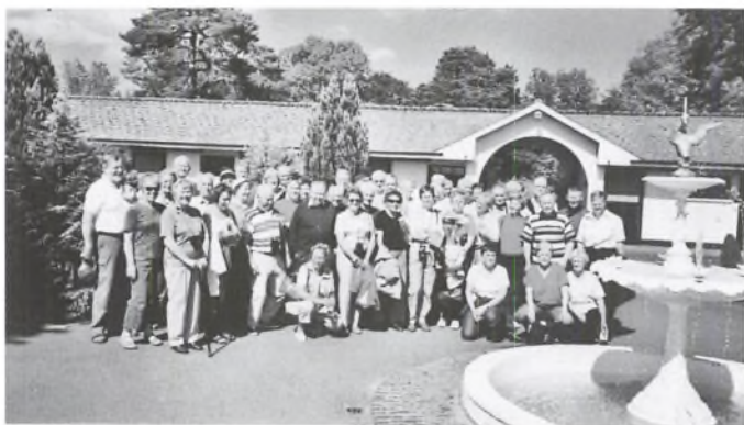
Rejseselskabet fotograferet foran staldanlægget på det nationale irske "vallakstutteri".

klippebjerg ved Cliffs of Moher, hvor klipperne hæver sig 200 lodret op af Atlanterhavet.