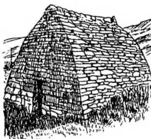
Kapellet – Gallarus Oratory. Det lille kapel måler 5 x 8 meter og er 5 meter højt. Det er opført i 700-tallet. Det er bygget i gammel keltisk stil af tørmur, men det er vandtæt.

Vi kom alle godt hjem også de fire, der fik en dag mere. Tilbage står erindringen af en stor rejseoplevelse, der netop blev så god, fordi vi havde Dolores Bruun til at lede og vejlede os.