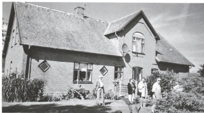
Brogård set fra haven.

Brogård - matr. nr. 8 i Høsten, Søndre Dalby Sogn i Fakse Herred kan føres tilbage til 1787 med følgende ejere: