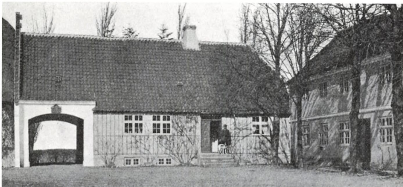
Skrøbelevgård o. 1900.