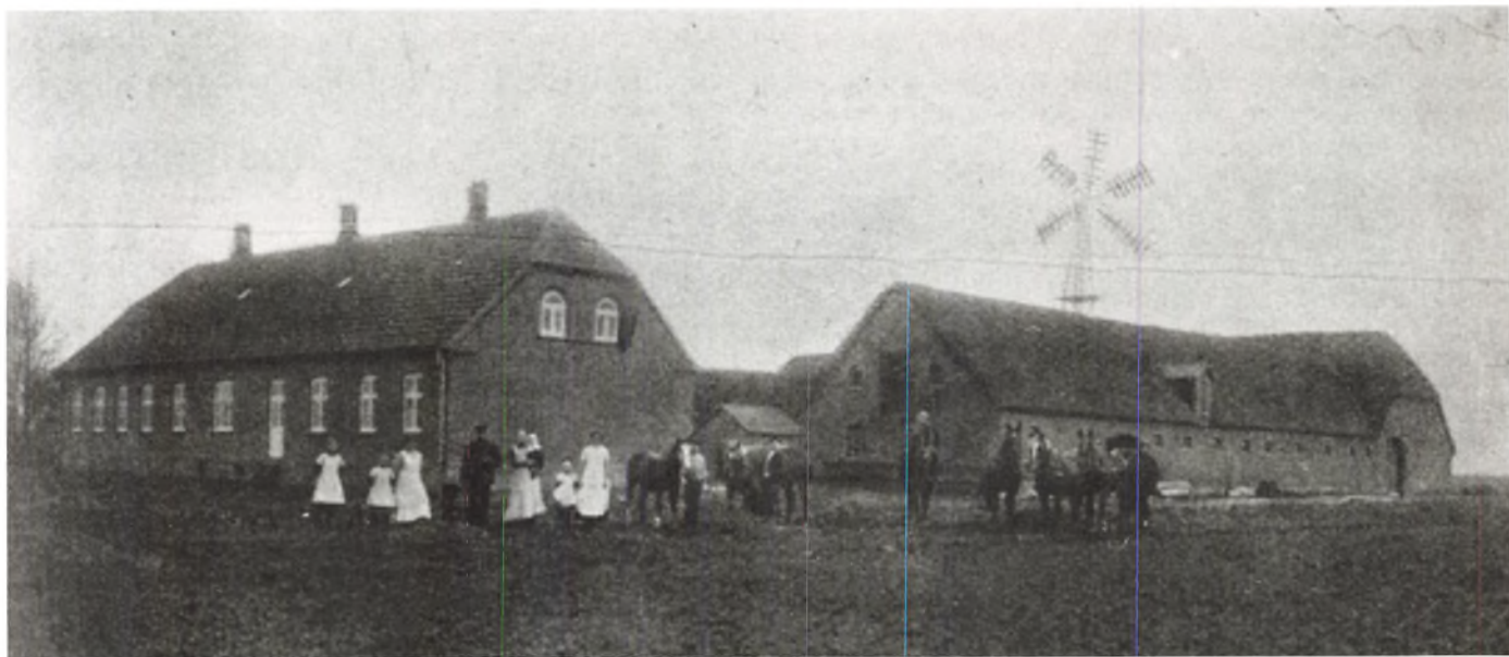
Nittrupgård o. 1915.