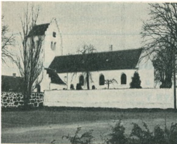
Soderup Kirke. Holbæk Amt.

Foruden Graniten finder man andre Materialer anvendt ved Opførelsen af vore gamle Landsbykirker, især Kalksten. Efter Midten af 1100-Tallet begynder man ogsaa at anvende Teglsten (»Munkesten«).