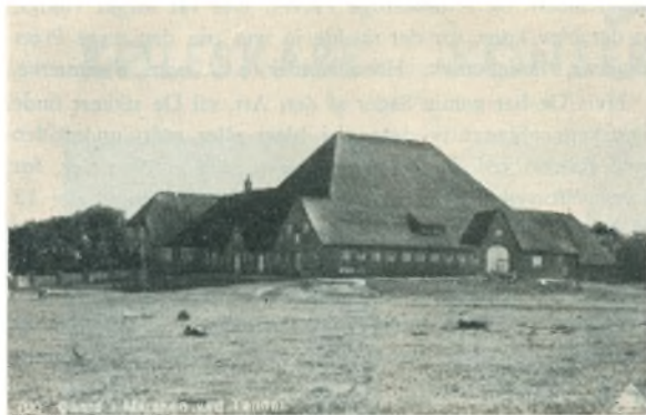
Gaard i Marsken ved Tønder.

flytte ind til et mere centralt Sted i Agerarealerne, f. Eks. hvor den nuværende Landsby Brøns ligger. Ganske vist er det kun en Teori, men den passer til alt, hvad vi senere ser af Danskeres og Friseres fredelige Samkvem og begge Parters Frontstilling mod Tyskerne. Endnu engang kom der dog Folk paa Astrup Banke, men da mere tilfældigt, som var det en Landingsplads for Kystskippere, der blot skulde overnatte paa Land: En Døl Lerkar fra Vikingetiden blev nemlig fundet ved Uugravingerne, Kar der nøje stemmer overens med Fund i selve Hedeby, og som vel derfor stammer fra Friserne, som da (d. v. s. ca. Aar 900) havde Sejladsen paa Nordsøen.