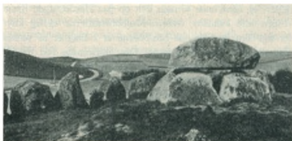
Mols. Posekær Stenhus.