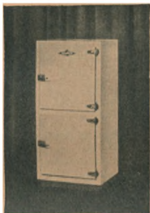
Langt mere økonomisk, fordi intet gaar til Spilde - og mere hygiejnisk!

København Fa. Helweg-Jørgensen. Ingeniør- og Handelsfirma, Gl. Kongevej 74, København V. Telefon Vester 7112.