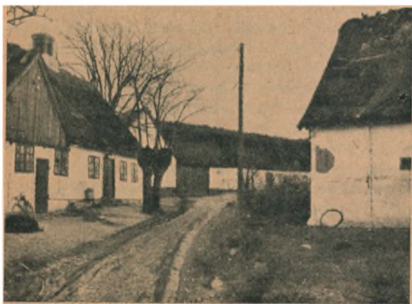
Landsbygade i den sydøstlige Del af Ordrup By, Sonnerup Sogn syd for Roskilde Fjord. Ordrup ligger paa en lille flad Højde, hvorfra Terrænet skraaner brat ned mod Elverdamsaaens Enge i Vest og opad mod Sydøst. Man ser her mod Sydvest ad en lille Sidevej, der flankeret af Landsbyhuse opført i første Halvdel af 1800 Tallet fører op til Gaard Nr. 2. I Gadeporten er der en Dør beregnet for den gaaende Færdsel. Tilhøjre herfor er Svine- og Kostalden. De synlige Længer er omtrent jævn gamle med Husene langs Vejen.

Det skal ingen Hemmelighed være, at Slægtsgaardsforeningen har haft Startvanskeligheder — naturligvis. For faa Aar siden havde Foreningen paadraget sig en Gæld paa ca. 12,000 Kr., men nu har Foreningen en Formue paa ca. 10,000 Kr. Det er ikke noget stort Beløb, og vi bør fortsat