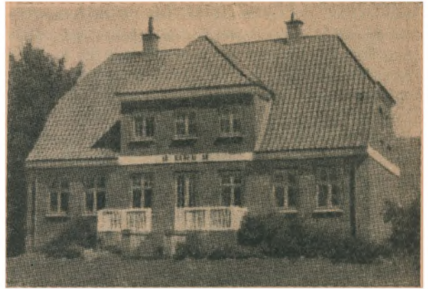
»Enrumgaard« i Søhus, Lumby Kommunes fremtidige Alderdomshjem.