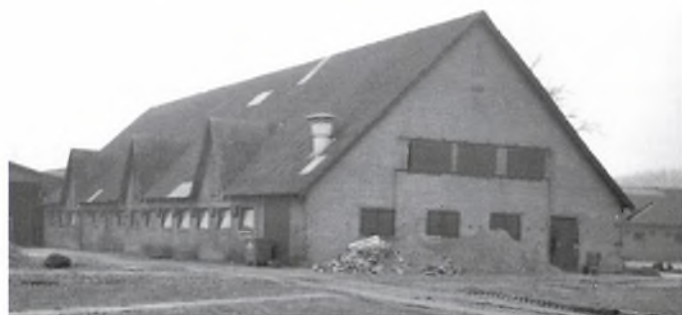
Staldlængen fra 1951 med plads til 30 køer.