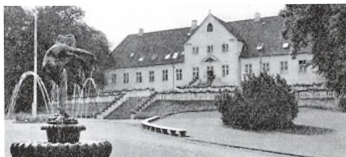
Bygholms hovedbygning set fra parken

Hovedbygningen stod indtil 1920 i blank gulstensmur, men er nu hvidkalket.