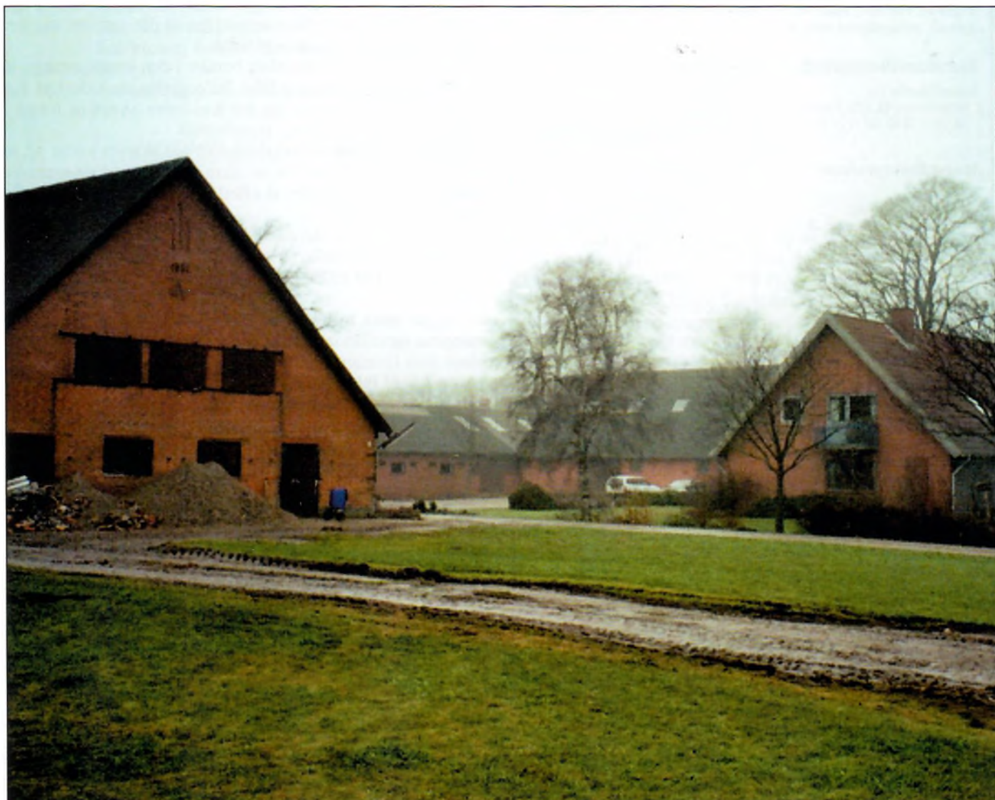
Søndergård ved Løsning bliver udgangspunktet for årsmødearrangementerne 27. - 28. maj 2006