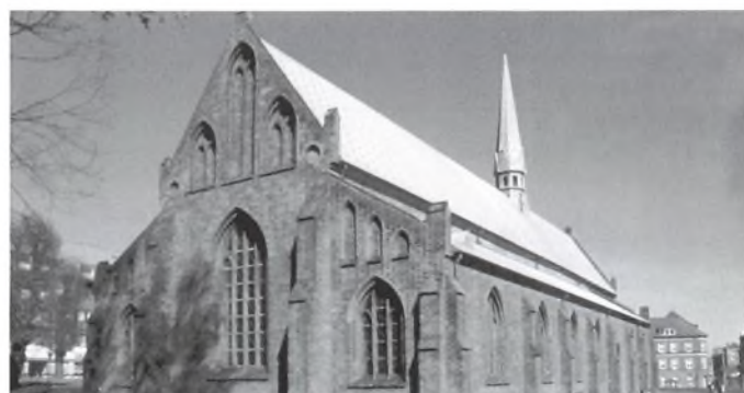
Klosterkirken i Horsens, den gamle Franciskanerklosterkirke. Når byen i 1300-tallet fik et klostresamfund af tiggermunke, bekræfter det byens økonomiske styrke som handelsby.

I slutningen 1700-tallet fik Horsens sit lille hof, idet to prinser og to prinsesser af den russiske zarfamilie tog ophold her i 1780. Det var børn af Anton Ulrich, Hertug af Braunschweig, broder til den danske dronning Juliane Marie, enke efter kong Frederik den Femte, og Anna af Mecklenburg, hvis ældste søn, Ivan, var blevet bestemt til russisk tronfølger af zarina Anna, men et år efter denne død i 1740 blev Ivan styrtet af Peter den Stores datter Elizabeth og tillige med sine forældre og fire søskende sat i fangenskab, sidst på en lille ø