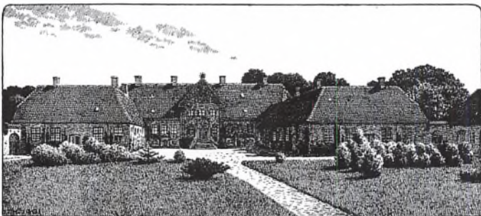
Hovedbygningen til herregården Bygholm, før den blev dækket af et lag hvidt puds.

Den øgede kornproduktion gav et større fødselsoverskud, og dette fødselsoverskud søgte bl. a. deres fremtid i købstæderne, hvor den begyndende industrialisering skabte muligheder.