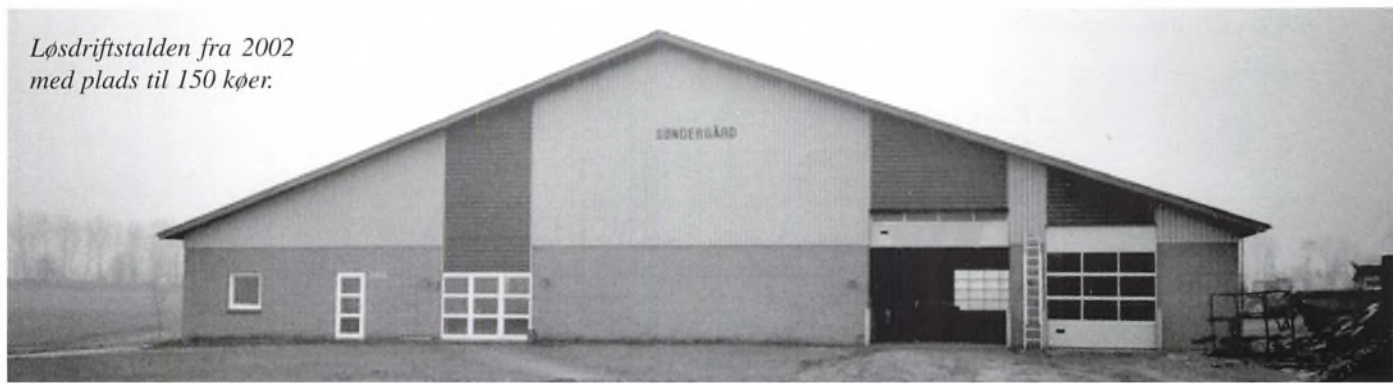
Løsdriftstalden fra 2002 med plads til 150 køer.