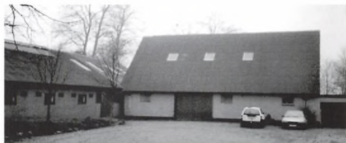
Det gamle stuehus fra 1864 blev i 1862 ændret til garage m. v.