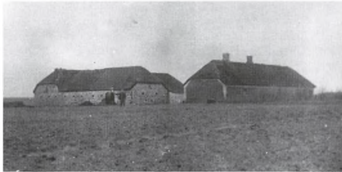
Bjerregård i Vesthimmerland. Foto o. 1875, men gården ser nok ud, som da den blev opført o. 1830.