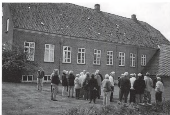
Fra besøget på Tyrstrupgård.