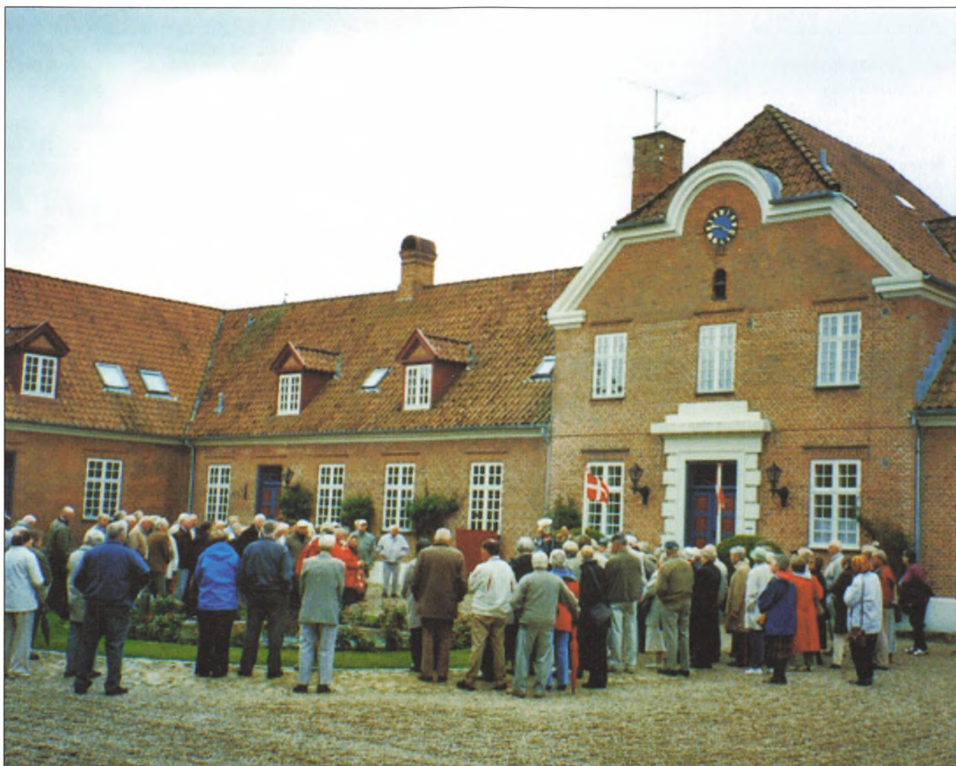
Fra årsmødeudflugtens besøg på Ørumgård.