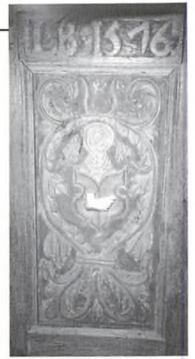
Slægten Barfods våbenskjold og hjelm-mærke, som det fremtræder på kirkebænken i Nr. Nebel kirke

I sommeren 1969 nedbrændte stald og lade på grund af lynnedslag."