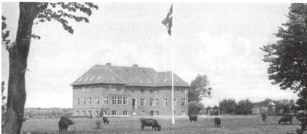
Hindholm Højskole 1935.