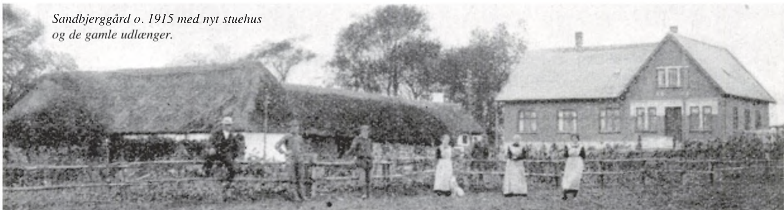
Sandbjerggård o. 1915 med nyt stuehus og de gamle udlænger.