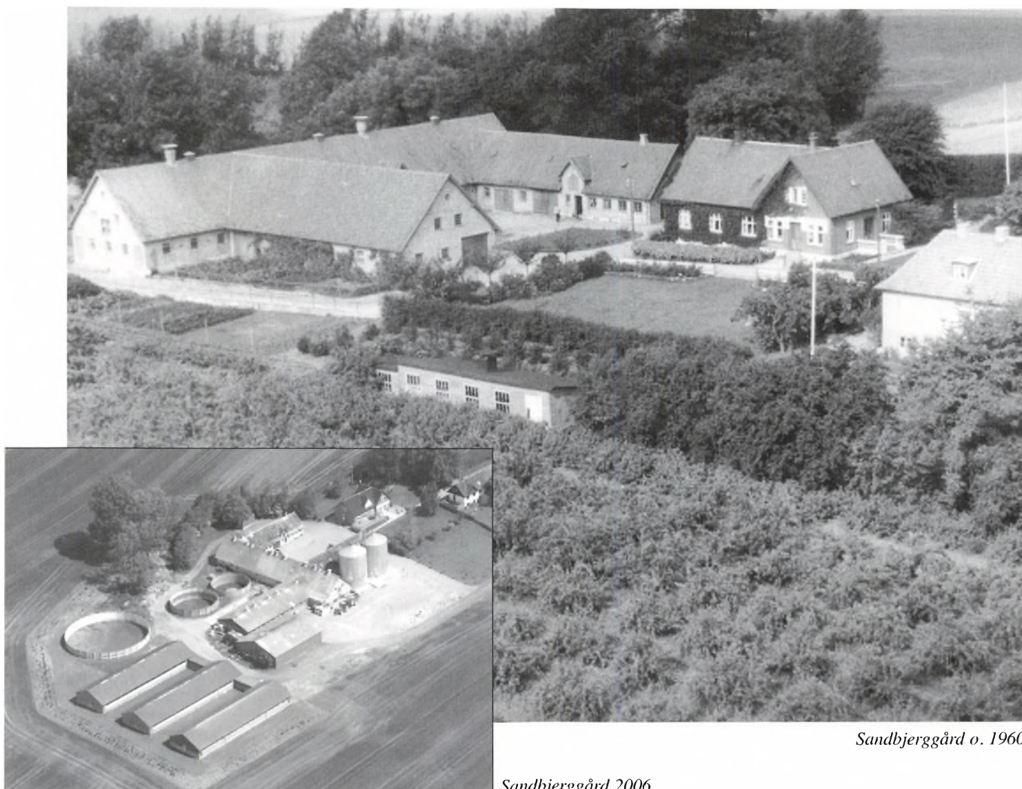
Sandbjerggård o. 1960