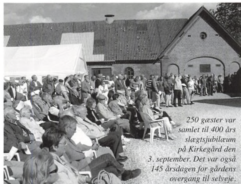
250 gæster var samlet til 400 års slægtsjubilæum på Kirkegård den 3. september. Det var også 145 årsdagen for gårdens overgang til selveje.

Det er flot, at man stadig har mod på at fortsætte 400 års tradition med malkekøer i en stadig omskiftelig verden. Til lykke til Kirkegård og hele familien Kirkegaard. Et leve for familien og Kirkegård!"