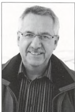
Af fødevarerminister Hans Chr. Schmidt (V)

Globaliseringen er den største udfordring for landbruget - så vel som for hele fødevarersektoren. Globaliseringen åbner nemlig op for nye markeder, og det skaber øget konkurrence på tværs af landegrænser. Når vi handler i supermarkedet, er hylderne fyldt med fødevarer fra hele verden. Verden er blevet mindre - markedet er blevet større.