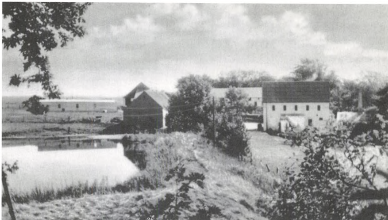
Gørding Mølle og Møllegård efter bran- den 1930.