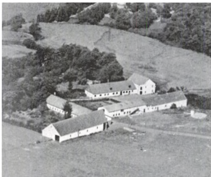
Gørding Møllegård efter branden 1930.

Den østlige længe i gården var svinestald og to hestestalde. Hele marken ligger øst for gården, ca. 80 tdr. land fra åen til Lourupvej.