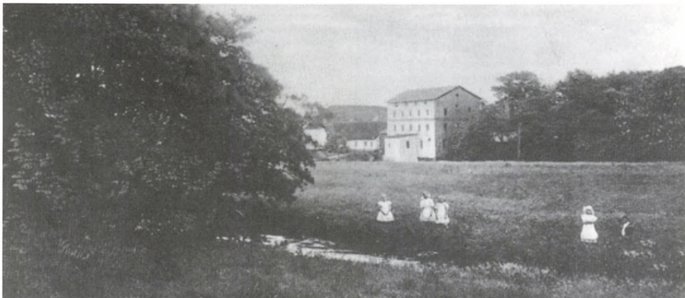
Gørding Mølle og Møllegård 1916.

Der var 80 tdr. land og af medhjælp var der 1 fodermester, 2 karle og 2 piger.