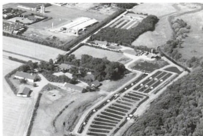
Gørding Møllegård og Dambrug 1991.

Kilder: Træk af Gørding sogns historie, bind 2. Protokoller fra arkivet i Gørding.