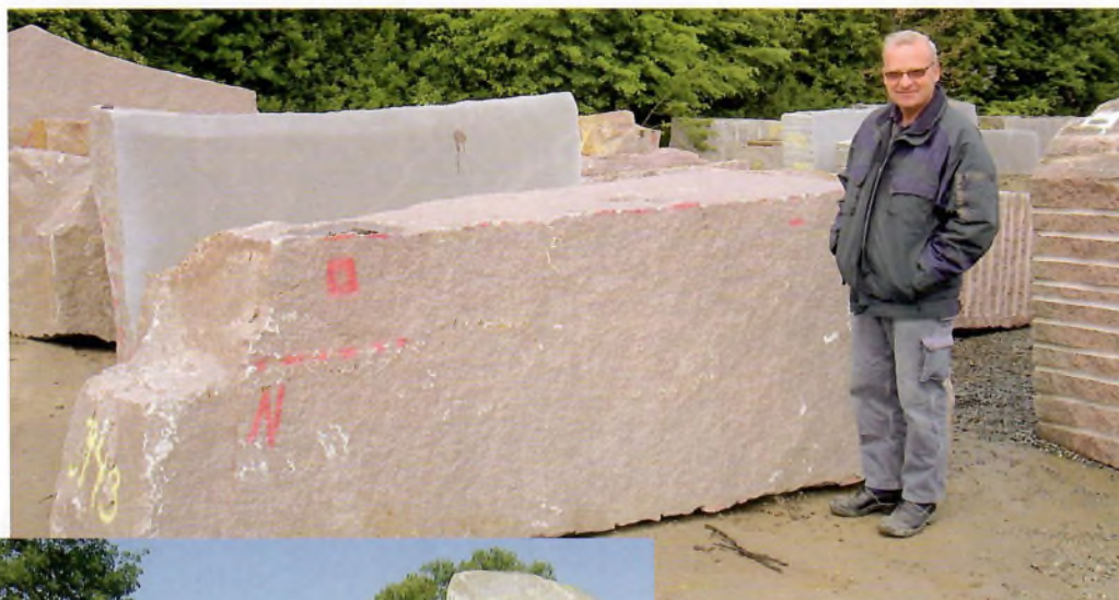
Hos stenimportøren i Nr. Snede