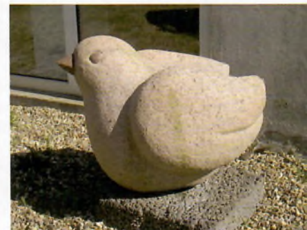
Tidligere værk - fra udstilling i Skive