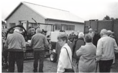
Forskningscenterets specialmaskine beundres.

Det meget givende besøg sluttede i centrets kantiner, hvor der ventede en dejlig frokost.