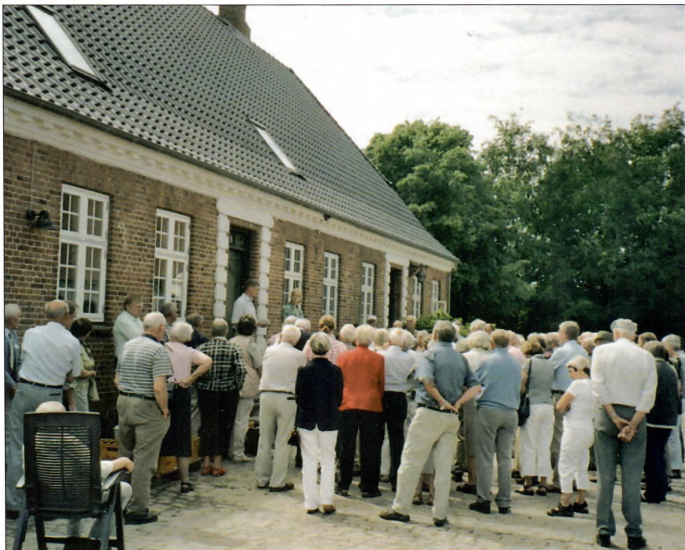
Årsmødeudflugtens deltagere samlet ved Asbjerggård