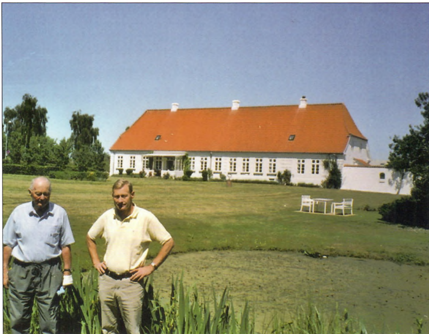
Sønderholm i Vonsild er et fornemt eksempel på en dansk slægtsgård. Gennem 10 led er gården vandret fra far til søn, og den gård som nu står, er samlet og bygget af slægten.