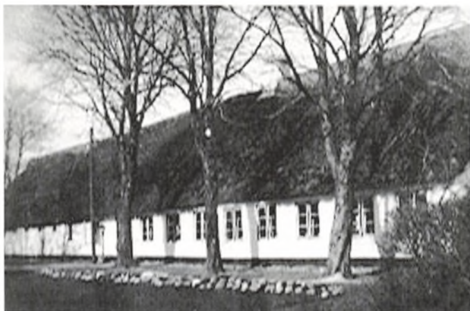
Det gamle stuehus.

Den første del af 1600-årene var meget urolige med krige og mange plyndringer ud over landet ikke mindst i Slesvig-Holsten. Christian den Fjerde deltog med stor iver i den europæiske 30-årskrige, hvilket satte sig mange spor i hertugdømmerne, hvor han var hertug. I lange tidsrum lå store områder mere eller mindre øde hen, og gårdene var tomme. Også én af Rangstrupgårdene nævnes på denne liste. I 1632 nævnes, at der kun betales ½ skat til Haderslevhus. Det kan også nævnes, at Christian den Fjerde lod afhente Agerskov kirkes lille klokke, da han skulle bruge dens malm til kanoner. Krigene og plyndringerne fortsatte hen over midten af 1600-tallet, hvor vi fik svenskekrigene med stormen på Køben-