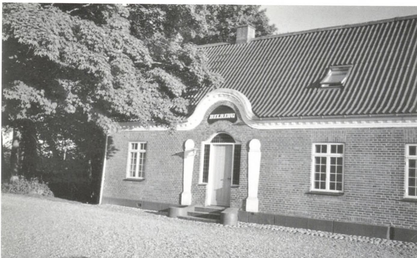
Stuehuset er opført i 1912 efter tegning af arkitekt Ulrik Plesner.

Holmsland alligevel (selv om) ded ligger to mile fra (gårdene), så er de steder jorden for samme årsagers skyld consideret (vurderet) noget bedre end de ellers kunne være anført for”.