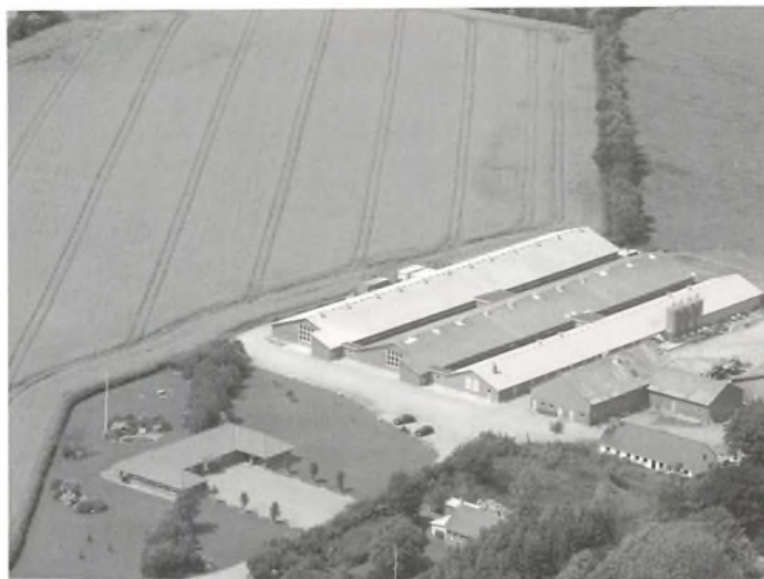
Bossens gård i jubilæumsåret.