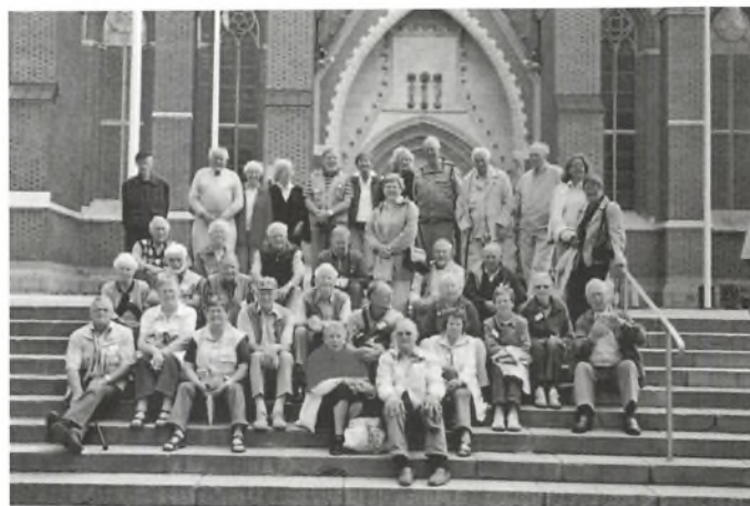
Gruppen foran domkirken i Uppsala.

Der findes 25 kommuner, hver med en kommunalbestyrelse. Finlands blev medlem af EU i 1995 efter en afstemning, og Åland stemte selv for medlemskabet.