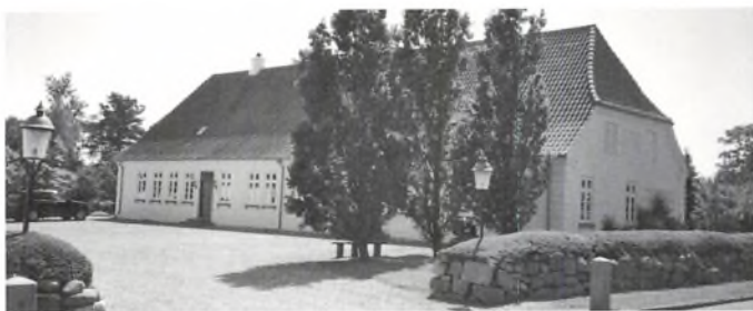
Hovedbygningen set fra vejen. Studehandlen var en meget betydelig eksportindtægt i midten af 1800-tallet. At studehandlen var meget givtig ses tydeligt den dag i dag. Når man kører rundt i de otte sogne, ser man mange steder meget store og flotte stuehuse, som typisk er bygget mellem 1840 og 1880 – studehandlens storhedstid.”

Om ham fortæller sønnesønnen Niels Hansen Tingleff i slægtsbogen: