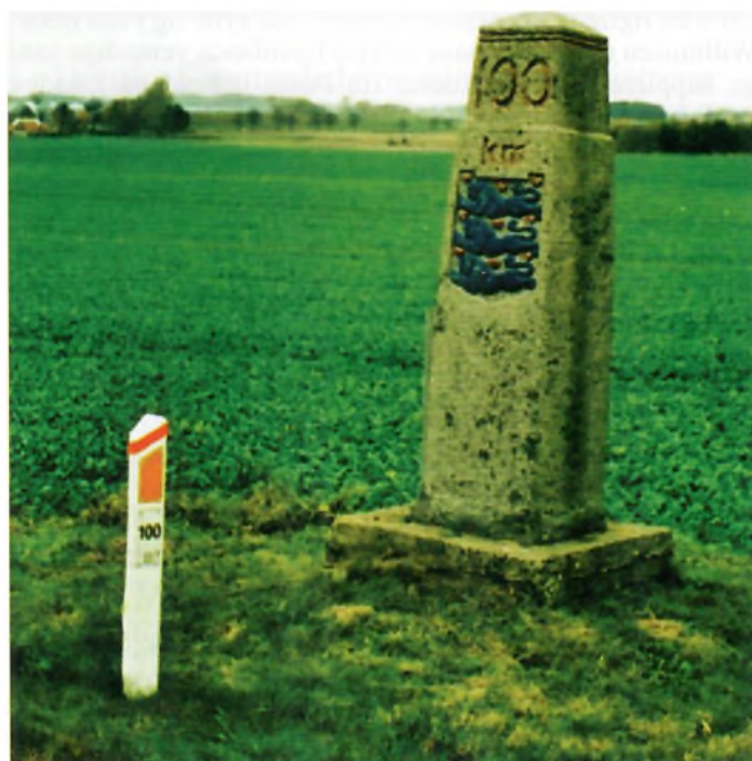
Arkitekt P. V. Jensens-Klints 100 km sten nær Korsør. Den hvide ”pæl” til venstre i billedet kaldes en præst. Den viser vejen, men går den ikke selv!

Nu har hele det europæiske fastland taget de ensartede enheder til sig, og det har lettet det internationale samarbejde.