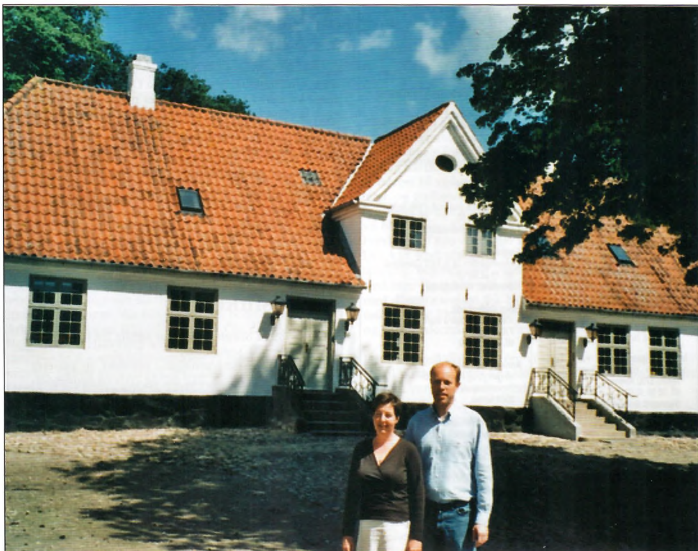
Lykkenssæde på Sydfyn.