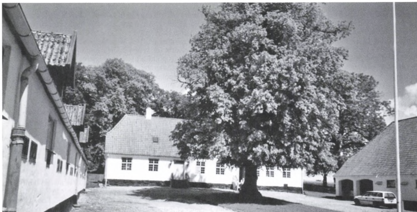
Lykkenssæde i dag

arbejdet i det almindelige landbrug. Rytmen i denne fællesdrift bestod i lugning af hørren, høslet, gødningskørsel og rughøst, som i øvrigt faldt sammen med hørusskningen. I løbet af efteråret var det hørren, der krævede den store arbejdsindsats.